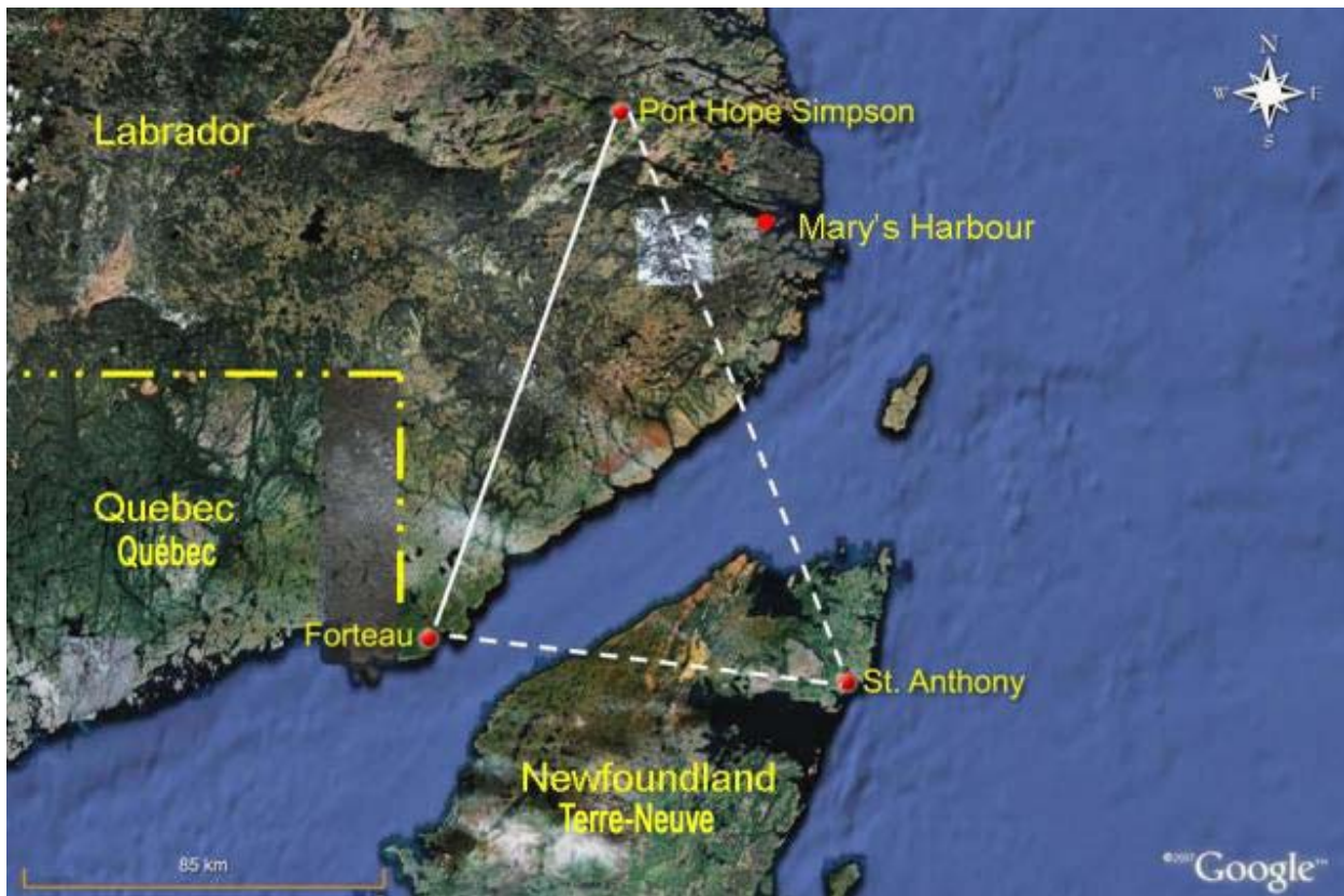
Figure 1. Carte du trajet

Vers 5 h 1 , l'hôpital de St-Anthony (Terre-Neuve-et-Labrador) a communiqué par téléphone avec le propriétaire de Strait Air 2000 Ltd pour demander un avion devant servir à l'évacuation sanitaire d'un patient de Port Hope Simpson à St. Anthony. Le pilote est appelé, les conditions météorologiques sont vérifiées et la décision est prise d'effectuer le vol dans des conditions météorologiques de vol à vue (VMC). Il est également décidé que si le temps se gâte, l'avion devra retourner à Forteau et y attendre que la situation s'améliore. Un plan de vol selon les règles de vol à vue (VFR) est déposé indiquant que l'avion va faire un aller-retour, décollant de Forteau pour se rendre à Port Hope Simpson puis à St. Anthony avant de revenir à Forteau (voir la figure 1).