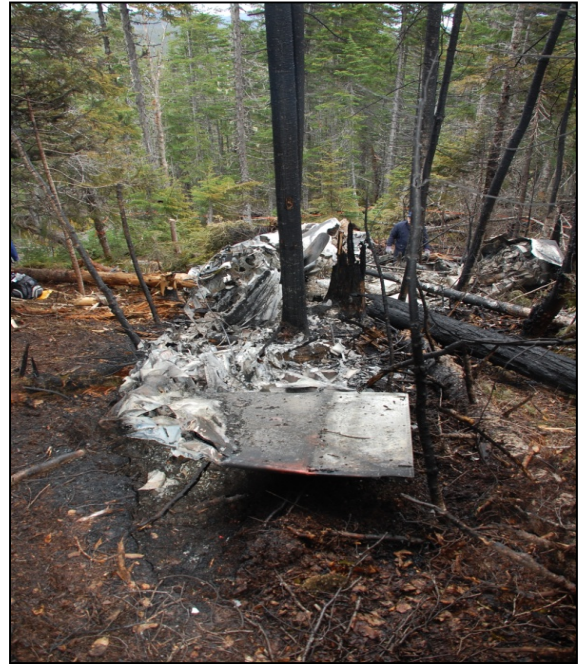
Photo 2. Lieu de l'accident vu de l'extrémité de l'aile gauche, en regardant vers le bas de la pente.

Il n'y avait aucun signe de défaillance de la structure ni du système de commande de vol avant l'impact. Les dommages subis par les hélices et les casseroles des deux moteurs montrent que ceux-ci tournaient au moment de l'impact. Rien n'indique qu'il y avait une condition préexistante qui aurait pu nuire au bon fonctionnement des moteurs.