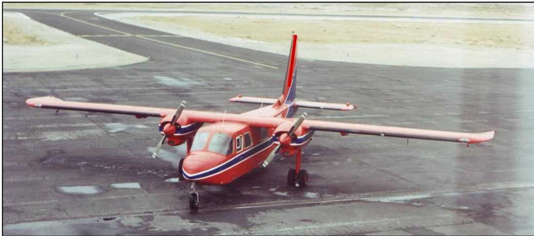
Photo 1. Photo montrant un Islander

L'Islander est un avion bimoteur à voilure haute et train d'atterrissage tricycle fixe (voir la photo 1). Le C-FJJR était certifié et équipé pour le vol IFR. Il était également doté d'un système de positionnement global (GPS) qui pouvait être utilisé pour effectuer une approche au GPS à Port Hope Simpson. Toutefois, l'entreprise n'avait pas l'approbation nécessaire pour effectuer des approches aux instruments GPS, ni pour les vols IFR à un seul pilote parce que l'avion n'était pas équipé d'un système de pilotage automatique fonctionnel. L'avion, équipé de réservoirs de carburant normaux et de réservoirs d'extrémité d'aile optionnels, a quitté Forteau avec un plein de carburant (154 gallons impériaux, une quantité suffisante pour environ 5,5 heures de vol). Bien qu'équipé de systèmes d'antigivrage et de dégivrage, l'appareil n'était pas approuvé pour le vol dans des conditions givrantes. Il était équipé d'une radiobalise de repérage d'urgence (ELT), mais aucun signal n'a été reçu après l'impact.