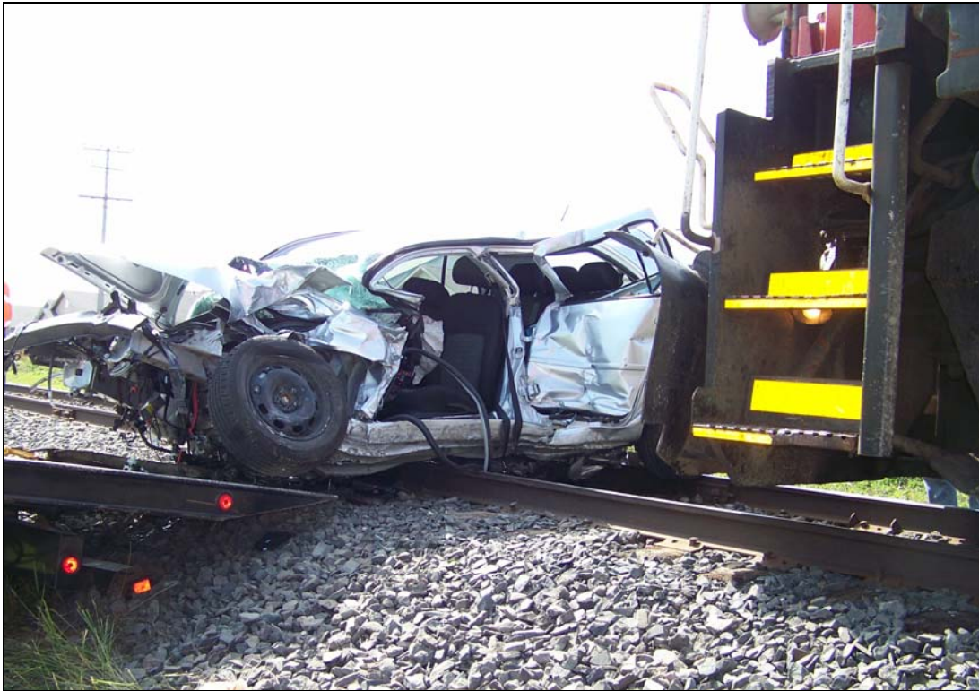
Photo 1. Volkswagen coincée sous l'avant de la locomotive

La police, les services d'incendie et le personnel des secours médicaux d'urgence interviennent sur les lieux de l'accident. La Volkswagen est détruite, et le conducteur est prisonnier de la voiture démolie. Les secours d'urgence ne disposent pas d'équipements (comme des écarteurs hydrauliques, appelés aussi « mâchoires de survie ») qui pourraient les aider à extraire la victime de la voiture. Dès qu'il est libéré, le conducteur est transporté à l'hôpital.