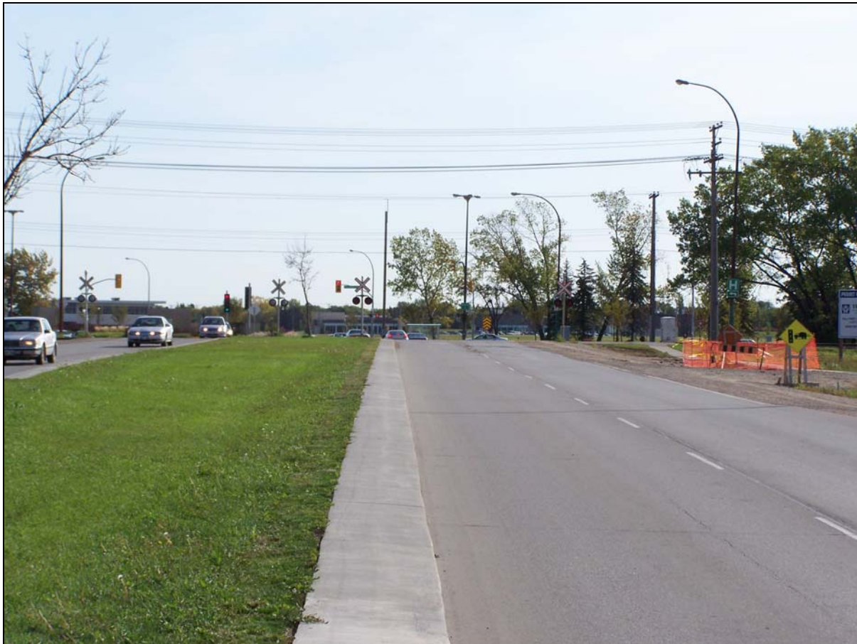
Photo 2. Passage à niveau vu de la voie médiane de l'avenue Bison, face à l'est

Un peu au nord du passage à niveau, une rangée d'arbres empêchait les automobilistes roulant vers l'est de bien voir vers le nord. Au sud du passage à niveau, il y avait un immeuble de condominiums de hauteur moyenne en cours de construction, qui gênait la visibilité vers le sud.