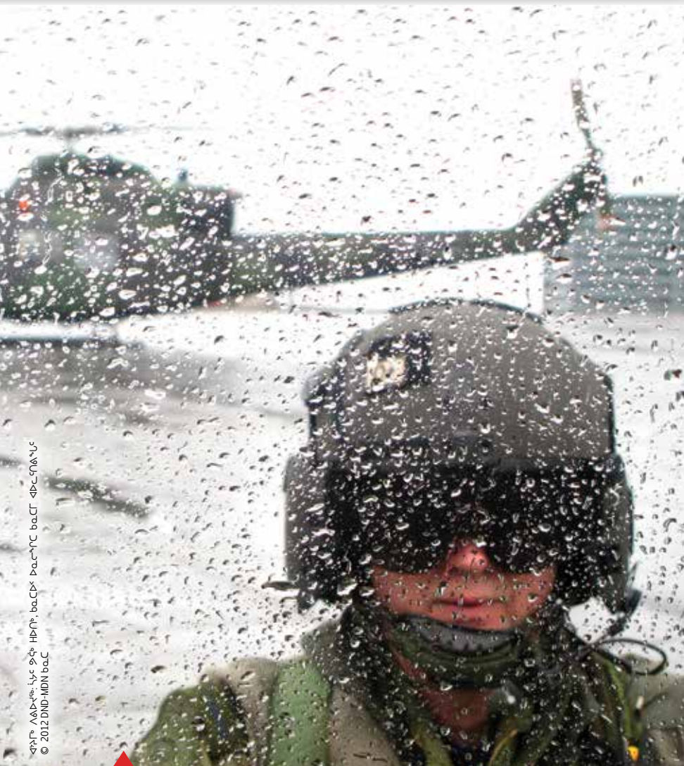
ቆይታ ለልዩ ስርዓት ያዩት ዘይቤ ይዘገባል። በአርማሪ ልብ ወለድ ስርዓት ላይ ስርዓት ይዘገባል።

ፎርሜሽንን ለማቆም አጠቃላይ ስርዓት ለማድረግ ለሚችሉት ስርዓት ላይ ስርዓት ይዘገባል።