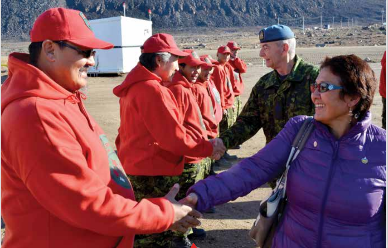
DND-ը գեներալ Վահագն Մանուկյանի ղեկավարությամբ Սեբաստիանի քաղաքում իրականացրած մարտական հարցազրույցի ժամանակ

Երկրամասի ղեկավարը և Սեբաստիանի քաղաքի մայր քաղաքի քաղաքացիական ծախսերի կոորդինատորը Սեբաստիանի քաղաքում իրականացրած մարտական հարցազրույցի ժամանակ