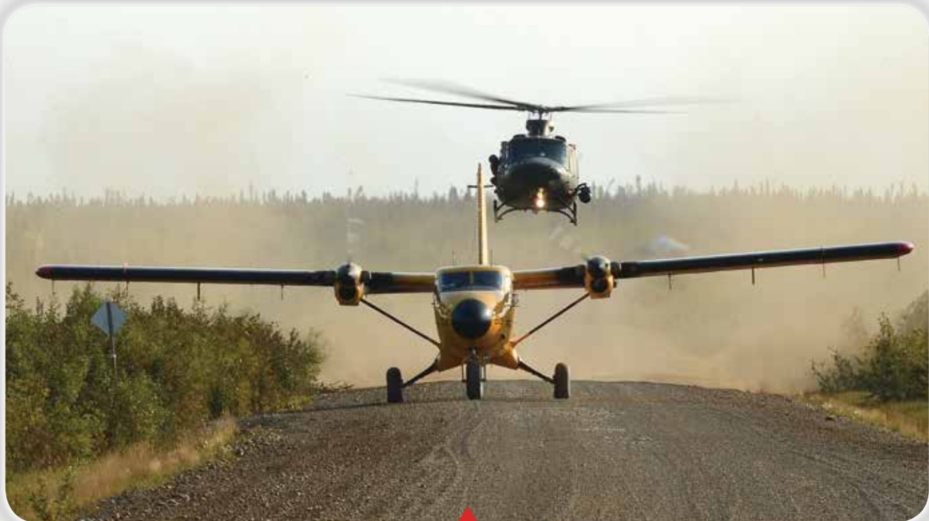
ግብይት ለማድረግ፡ የግብይት ልማት ለሰፈራዊ ስፍራ ለግብይት ልማት ለሰፈራዊ ስፍራ ለግብይት ልማት ለሰፈራዊ ስፍራ