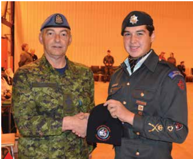
DND-ը գեներալ Վահագն Մանուկյանի ղեկավարությամբ Սեբաստիանի քաղաքում իրականացրած մարտական հարցազրույցի ժամանակ

Վահագն Մանուկյանի ղեկավարությամբ Սեբաստիանի քաղաքում իրականացրած մարտական հարցազրույցի ժամանակ