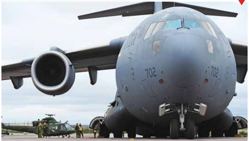
ቆይታ ለልዩ ስርዓት ያዩት ዘይቤ ይዘገባል። በአርማሪ ልብ ወለድ ስርዓት ላይ ስርዓት ይዘገባል።

ጎንደር ስርዓት ለሚችሉት ስርዓት ላይ ስርዓት ይዘገባል። ለሚችሉት ስርዓት ላይ ስርዓት ይዘገባል።