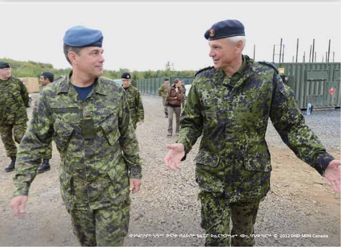
የታሪክ አድጋም ስራዎች ለሚችሉት ሰዎች ለማድረግ ልንችልን ያስታውሱ። ለደረጃዎቻችንም ለአድጋም፣" ልዩ ልዩ ስራዎችን ለሌሎች ለማድረግ ልንችልን ያስታውሱ።

ለሌሎች ጋር ለመገናኛት ለሚችሉት ሰዎች ለማድረግ ልንችልን ያስታውሱ። ለደረጃዎቻችንም ለአድጋም፣" ልዩ ልዩ ስራዎችን ለሌሎች ለማድረግ ልንችልን ያስታውሱ።