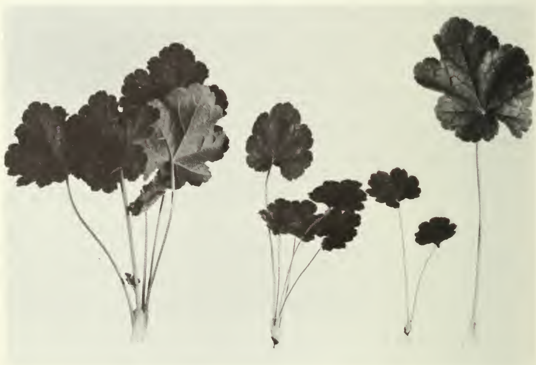
Boutures d'heuchères prêtes pour la multiplication; grosses boutures (à gauche) et petites boutures (à droite).

Normalement, on multiplie les heuchères par division ou par voie de semis. Les variétés qui se reproduisent par la semence ne sont pas recommandées dans les Prairies, les cultivars rustiques se multipliant généralement par division. Les plantes peuvent être divisées au printemps ou à l'automne, mais le moment le plus propice est juillet et août, juste après la floraison. La grosseur des morceaux