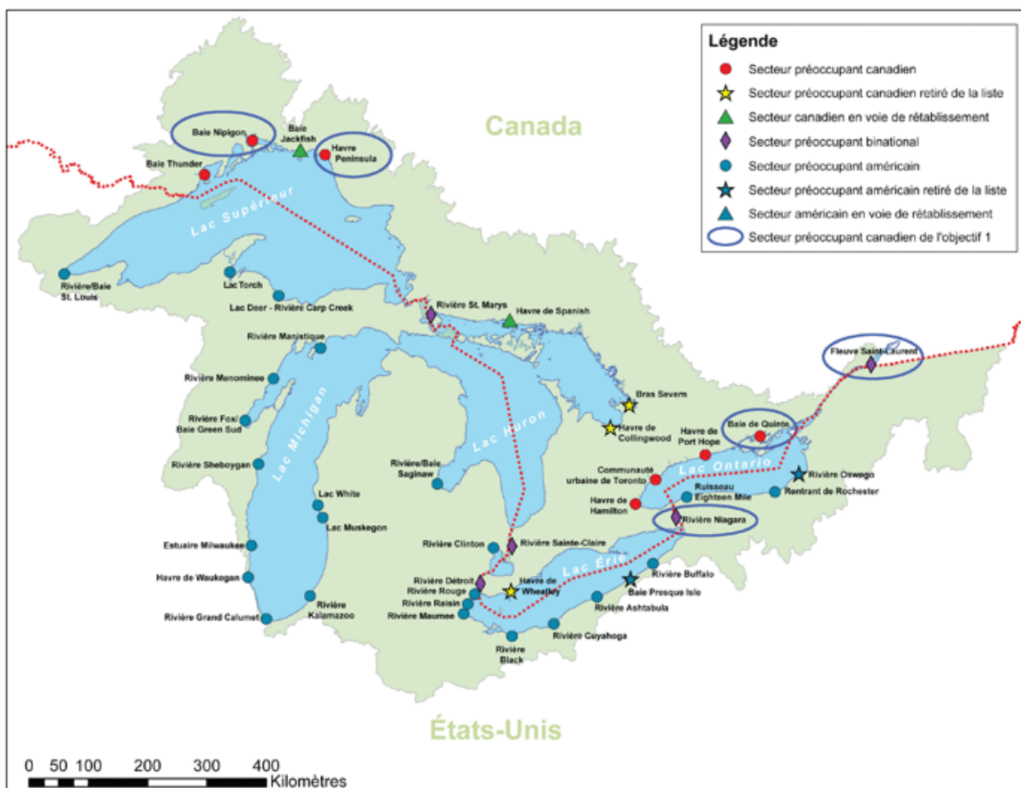
Carte des secteurs préoccupants des Grands Lacs

OBJECTIF 1 : MENER À TERME DES MESURES PRIORITAIRES POUR LE RETRAIT DE LA LISTE DANS CINQ SECTEURS PRÉOCCUPANTS : LA BAIE NIPIGON, LE HAVRE PENINSULA, LA RIVIÈRE NIAGARA, LA BAIE DE QUINTE ET LE FLEUVE SAINT-LAURENT (CORNWALL).