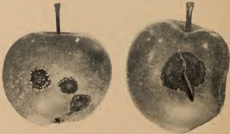
Figure 3: Tache de tavelure sur les pommes. Le crevassement est fréquent sur les vieilles taches.

Les rameaux des variétés très sensibles de pommiers peuvent être atteints de tavelure; l'infection se produit lorsqu'ils sont encore bien verts et tendres. La maladie apparaît sous forme de petites lésions rondes à oblongues dont le diamètre dépasse rarement un huitième de pouce. Elles sont plus faciles à déceler à l'automne.