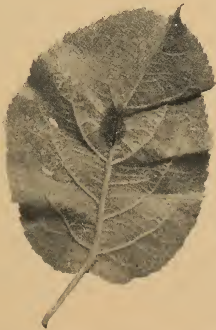
Figure 1: Revers d'une feuille montrant des infections primaires.

Le présent bulletin a été rédigé en vue de familiariser les pomiculteurs avec la cause de la maladie ainsi qu'avec le rapport qui existe entre cette dernière et les conditions atmosphériques, et dans l'espoir aussi qu'une meilleure compréhension de ce rapport amènera une application plus efficace des mesures de répression.