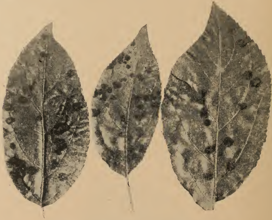
Figure 2: Forme ordinaire de la tavelure sur le feuillage.

Les parties exposées des fleurs sont susceptibles à l'infection et on verra fréquemment la maladie encercler le pédoncule et faire tomber une quantité considérable de fleurs et de jeunes fruits. Les lésions qui se présentent sur les parties de la fleur ne sont pas aussi manifestes que celles des feuilles: leur coloration est plus claire et elles sont disséminées.