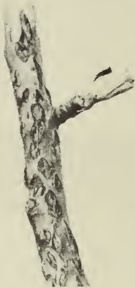
Figure 1. - Cicatrices de la ponte des oeufs de la cèrèse buffle dans l'écorce d'un jeune pommier.

Les dégâts sont causés par les femelles qui pratiquent de profondes incisions dans l'écorce tendre lors de la ponte de leurs oeufs. Les incisions sont faites sur la surface supérieure des branches basses et sur le tronc des jeunes arbres. Les arbres plus âgés sont rarement endommagés. Ordinairement les oeufs ne sont pas déposés sur les arbres à plus de six ou sept pieds du sol. La femelle fait deux incisions légèrement courbées et opposées l'une à l'autre et y dépose de six à douze oeufs dans chacune. L'écorce entre les deux incisions ne se guérit pas et forme une vilaine cicatrice qui s'agrandit durant plusieurs années (Figure 1). Le développement des arbres ainsi sérieusement avariés peut être retardé et dans les cas graves les jeunes pousses peuvent en mourir.