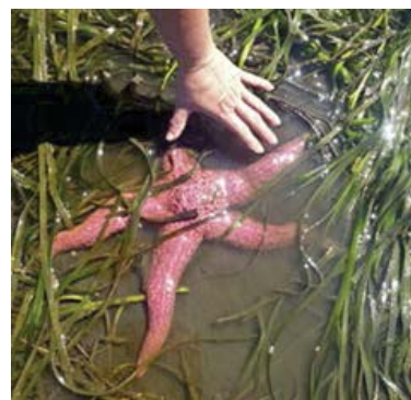
Des étoiles de mer mauves et roses, qui colonisent gaiement un nouvel habitat de zostère dans les eaux au large de Comox, en Colombie-Britannique, ont été exposées par la marée basse.

Le projet a bénéficié du partenariat entre Project Watershed, organisation locale sans but lucratif dont la principale activité est la restauration de l'habitat de la zostère, et Cooper Beauchesne and Associates, société d'experts-conseils en environnement bien établie dont le nom figure sur la liste de ressources biologiques de CDC. La création de cette association