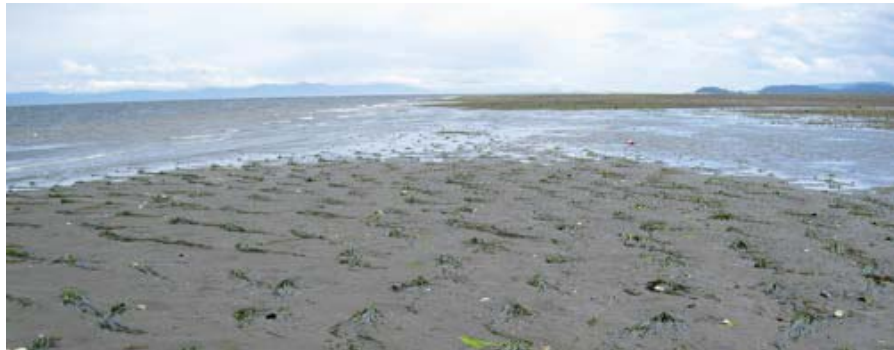
Pousses de zostère transplantées du côté ouest, à marée basse.