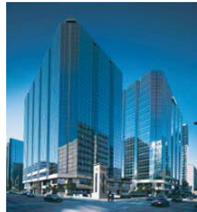
180 rue Kent - Premier édifice d'Ottawa avec la certification « or » de LEED

Le bureau sera aménagé sur trois des étages d'une nouvelle tour à bureau récemment construite, au 180, rue Kent, au centre-ville d'Ottawa. L'édifice a été construit selon les principes de la construction écologique et son emplacement pour les nouveaux bureaux a été choisi dans le cadre d'un concours.