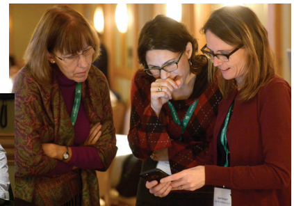
Partage des connaissances