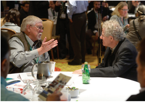
Participants au symposium La science en mouvement dans une discussion animée.