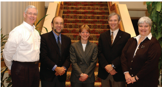
Annnonce des équipes en voie de formation sur l'arthrose.