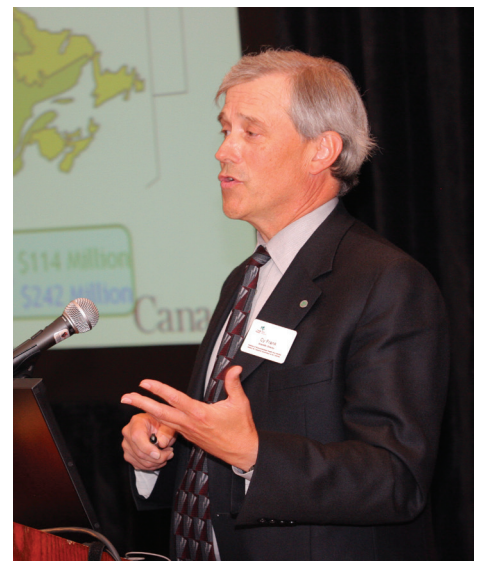
Forum ouvert du CCI, Halifax, 2006.