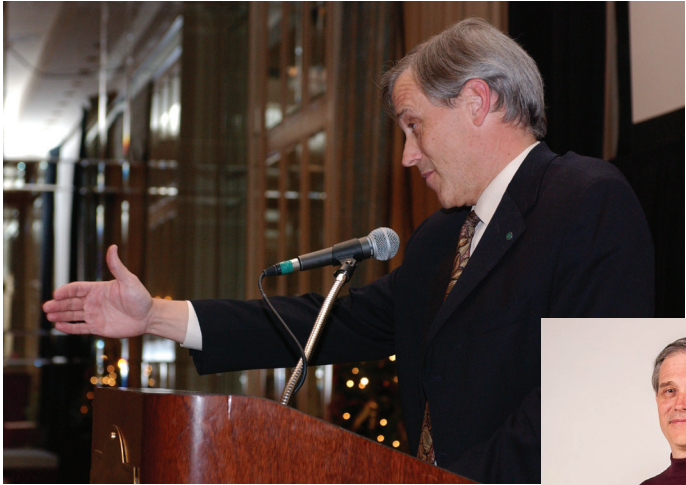
Annnonce des équipes en voie de formation sur l'arthrose.

"Mille mots ne seront pas laisser une impression si profonde comme un acte." - Henrik Ibsen