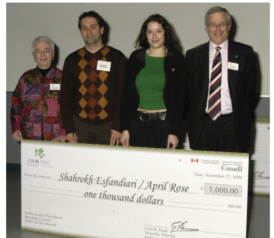
Remise de prix pour une présentation par affiches : IALA en action, Calgary, 2006.