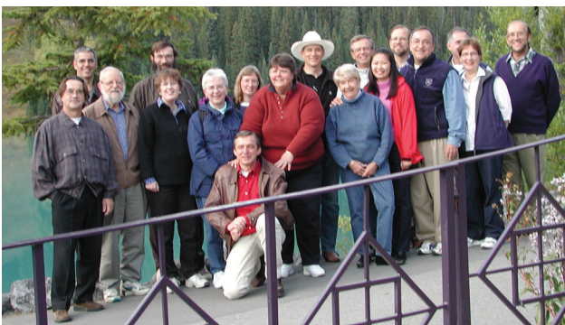
Première séance de réflexion du CCI, 2001.