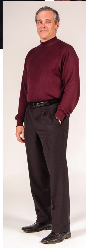
Profil des IRSC.