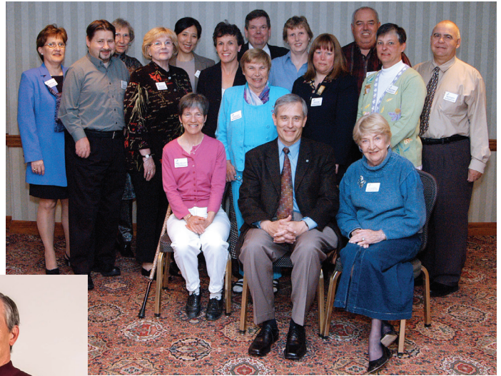
Membres du Groupe de travail sur l'échange des connaissances (GTEC).