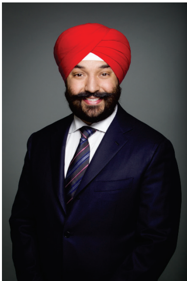
L'honorable Navdeep Bains Ministre de l'Innovation, des Sciences et du Développement économique

C'est avec plaisir que je présente le Rapport ministériel sur le rendement de l'Agence spatiale canadienne pour l'exercice 2014-2015.