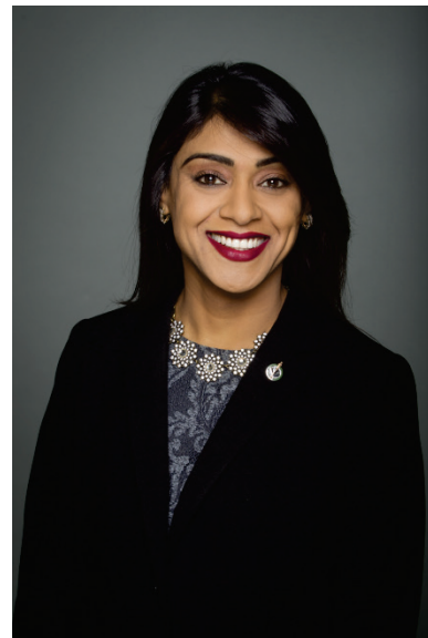
L'honorable Bardish Chagger Ministre de la Petite Entreprise et du Tourisme