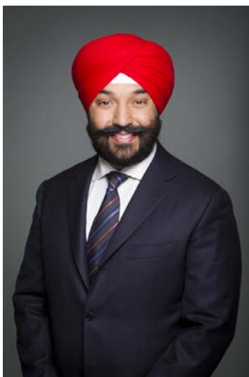
L'honorable Navdeep Bains Ministre de l'Innovation, des Sciences et du Développement économique

C'est avec plaisir que nous présentons le Rapport ministériel sur le rendement du Conseil de recherches en sciences humaines pour l'exercice 2014-2015.