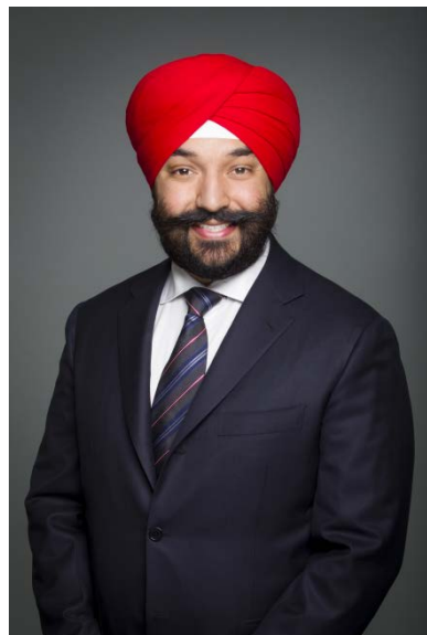
L'honorable Navdeep Bains Ministre de l'Innovation, des Sciences et du Développement économique

C'est un honneur pour nous de présenter le rapport ministériel sur le rendement 2015-2016 du CRSH.