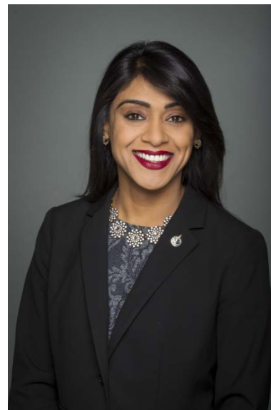
L'honorable Bardish Chagger Ministre de la Petite Entreprise et du Tourisme et Leader du gouvernement à la Chambre des communes