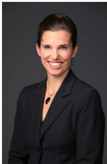
L'honorable Kirsty Duncan Ministre des Sciences