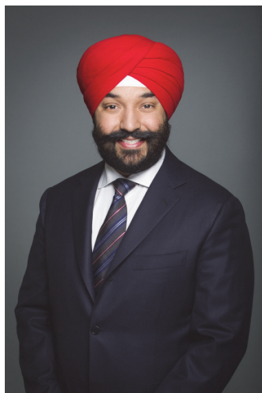
L'honorable Navdeep Bains Ministre de l'Innovation, des Sciences et du Développement économique

C'est avec plaisir que nous présentons le Rapport ministériel sur le rendement de FedDev Ontario pour l'exercice 2014-2015.