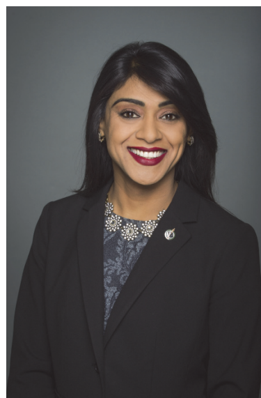
L'honorable Bardish Chagger Ministre de la Petite Entreprise et du Tourisme