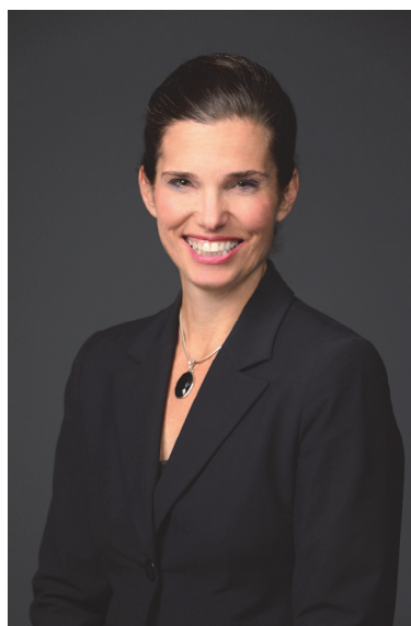
L'honorable Kirsty Duncan Ministre des Sciences