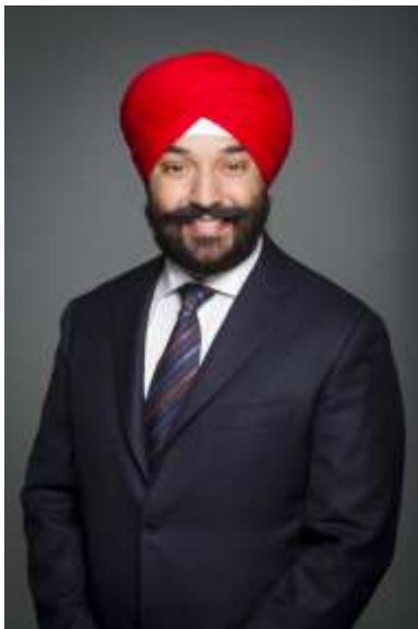
L'honorable Navdeep Bains Ministre de l'Innovation, des Sciences et du Développement économique

C'est un honneur pour nous de présenter le rapport ministériel sur le rendement 2015-2016 de l'Agence fédérale de développement économique pour le Sud de l'Ontario.