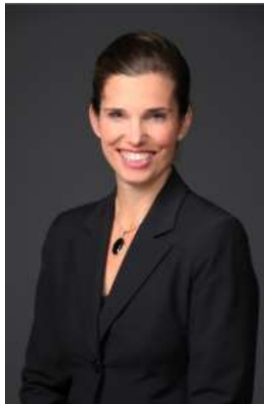
L'honorable Kirsty Duncan Ministre des Sciences