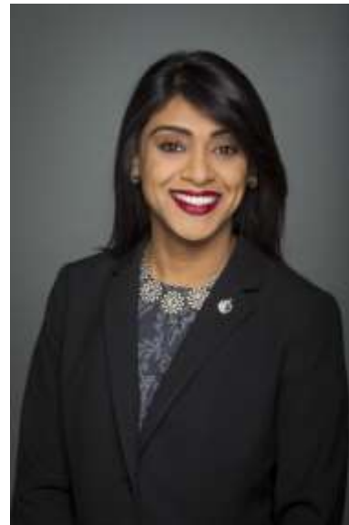
L'honorable Bardish Chagger Ministre de la Petite Entreprise et du Tourisme et Leader du gouvernement à la Chambre des communes