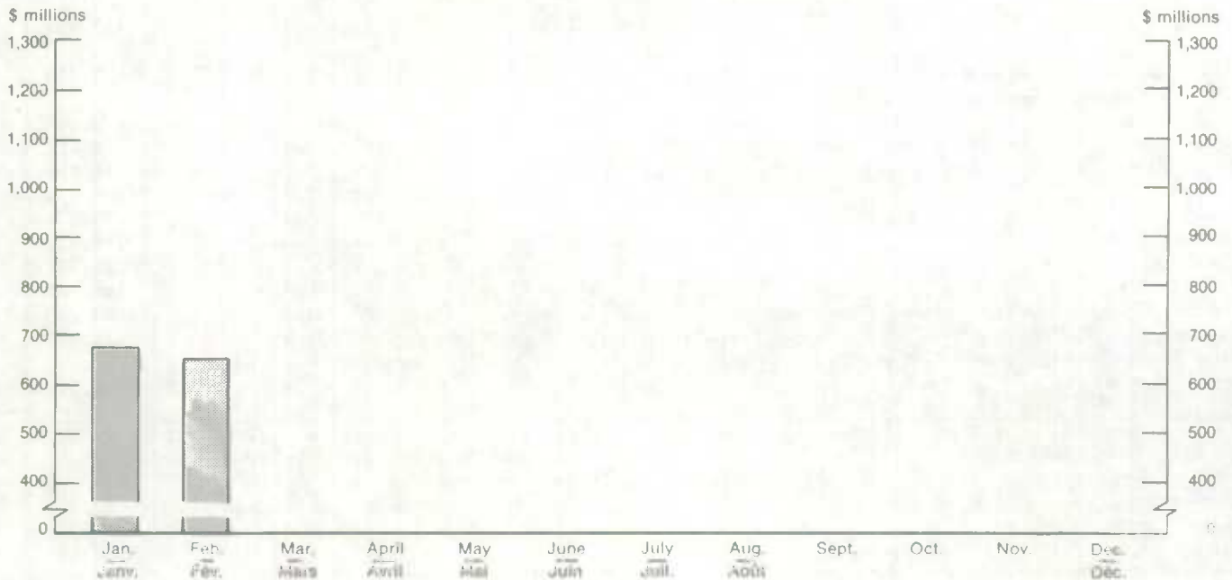
Recettes estimées des restaurants, traiteurs et tavernes, par mois, Canada, 1981