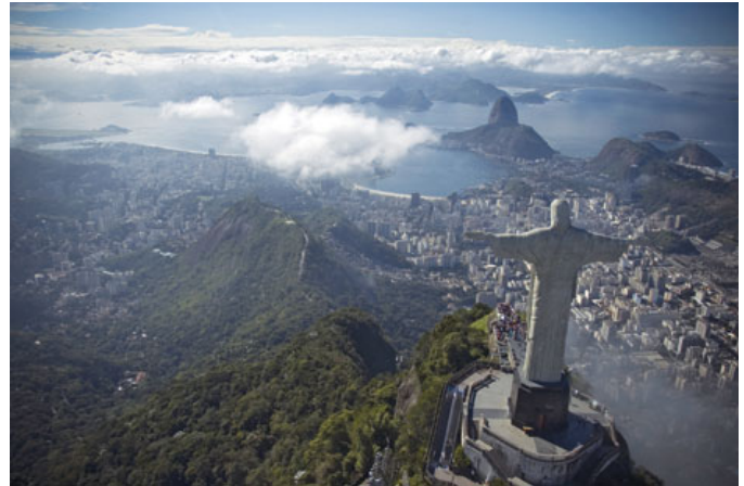
Rio de Janeiro, Brésil

Taux de change : 1 $CAN = 1,74 réal brésilien (BRL)