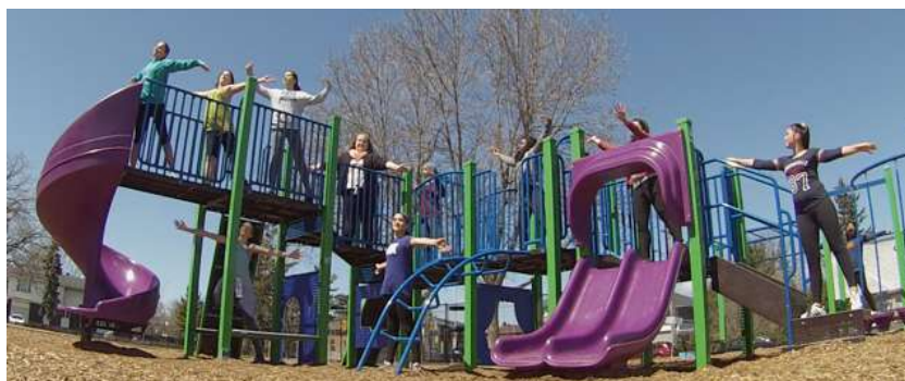
Photos (G-D) Participants de 7 e et 8 e année de l'école D.Roy Kennedy; Moving Stories à l'école Earl of March; le film Arabesque à l'école Woodroffe; Moving Stories à l'école Earl of March.