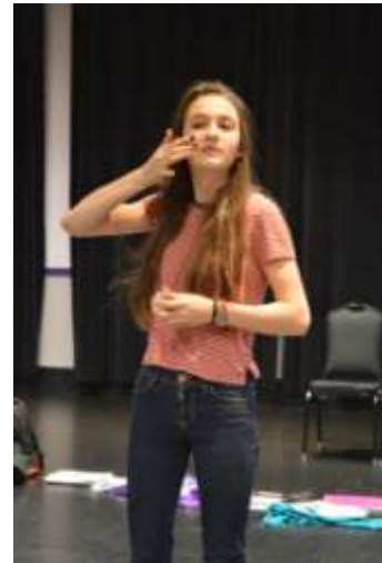
Photos (G-D) : Une ovation pour De plain-pied ; une participante se prépare pour le spectacle.