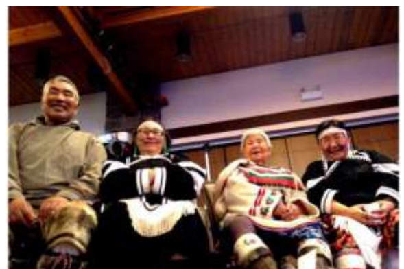
Photos (G-D): participants au sommet; danse en cercle; regard vers les aînés.

« C'était magnifique d'être ici à Iqaluit en compagnie de tous ces merveilleux artistes. Ce soir, nous avons réussi, et ce sera une semaine dont nous nous souviendrons. Ce voyage m'a tellement transformée. Je ne sais pas qui j'étais à la maison, mais maintenant je me sens revigorée. Merci à tous ceux qui m'ont enseigné tant de choses. »