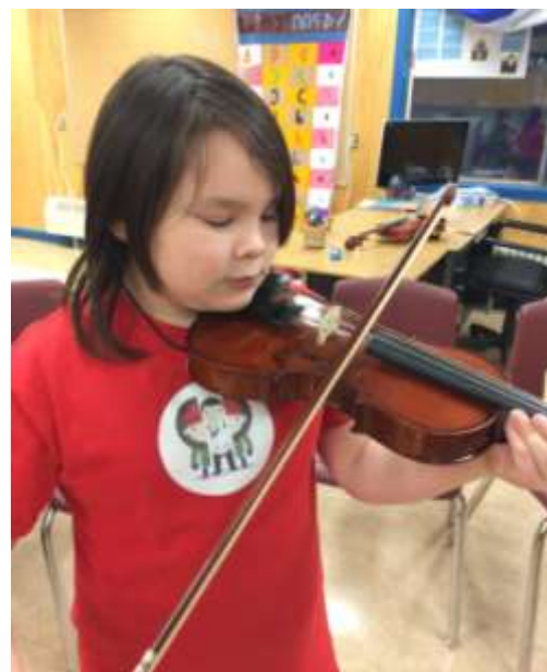
Photos (G-D) : Une élève de l'école secondaire Inuksuk fabrique une affiche pour un atelier de sensibilisation à la santé mentale donné par l'auteure-compositrice-interprète Amelia Curran. Photo du bas – Un élève de violon traditionnel à Kimmirut.