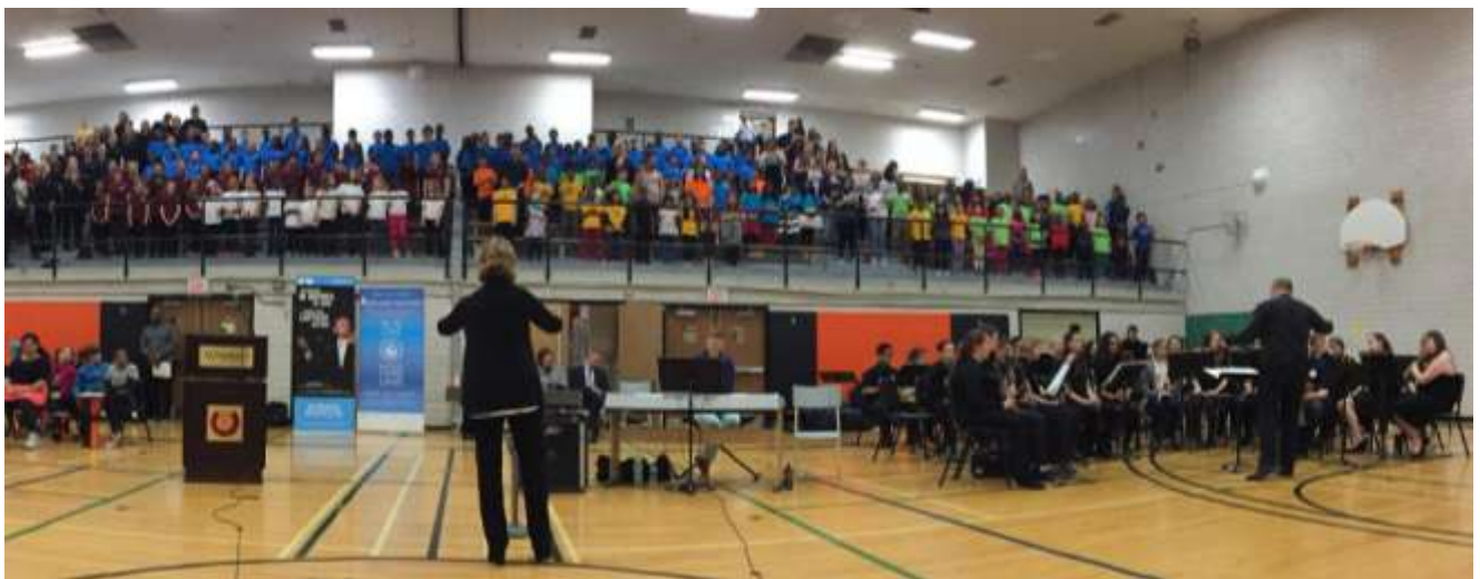
Photo: Lundi en musique à l'école Woodroffe.

Le 2 mai 2016, le CNA et la Coalition pour l'éducation en musique du Canada ont célébré le Lundi en musique avec la présentation d'un concert mettant en vedette des élèves de 10 écoles et chœurs communautaires à l'école Woodroffe. Environ 400 jeunes ont chanté avec des centaines de milliers d'enfants de partout au pays pour célébrer l'éducation musicale. Cette édition du Lundi en musique était présentée dans le cadre d'un nouveau projet-pilote de six semaines (Orchestre du CNA Remix) lancé conjointement par le CNA, la Ville d'Ottawa, le club Garçons et Filles d'Ottawa, et des écoles primaires, intermédiaires et secondaires des quartiers Foster Farm, Michele Heights, Bayshore et Britannia de l'ouest d'Ottawa.