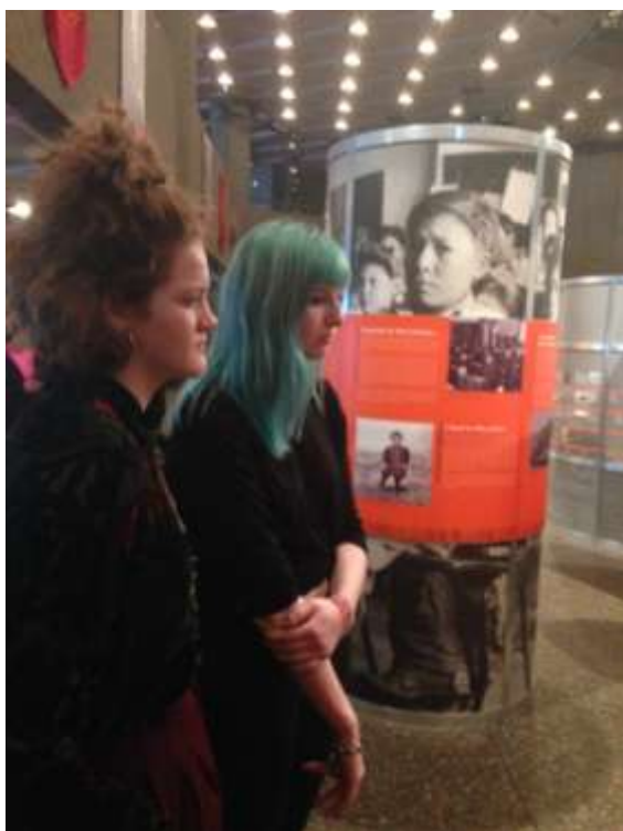
Photo: OICC Inuit Youth Group avec Tania Tagaq après la soirée d'ouverture (billets pour Share the Spirit )