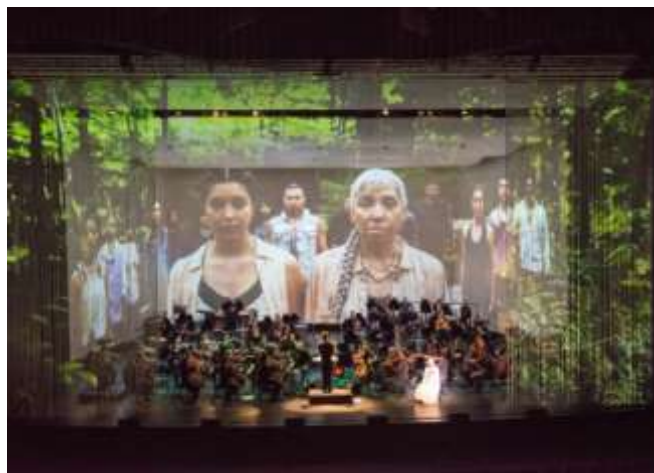
Photo: Les stagiaires de l'IMO au sein de l'Orchestre du CNA, lors du concert du 19 mai intitulé Réflexions sur la vie , présentant les quatre nouvelles œuvres.