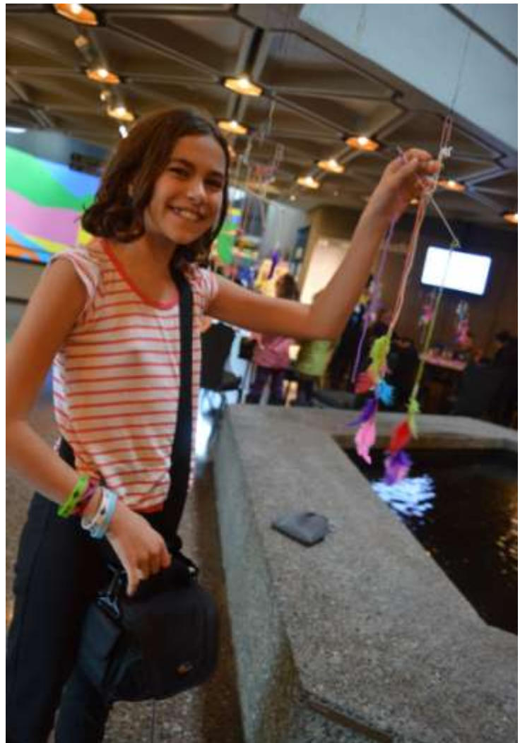
Photos: Des jeunes et leurs familles participent à des activités d'avant-spectacle du Théâtre français.