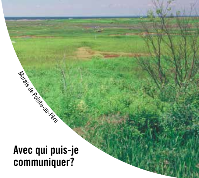
Marais de Pointe-au-Père