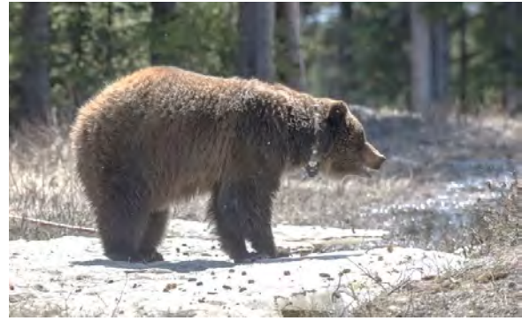
Depuis mai, Parcs Canada a posé un collier au cou de 10 grizzlis dans la moitié sud du parc.

Le caribou est exposé à cinq grandes menaces, dont les pistes de neige tassée qui aident les loups à gagner le territoire hivernal de l'espèce. Pour réduire ce risque, l'accès à l'habitat du caribou est interdit du 1 er novembre jusqu'à la fin de l'hiver. Depuis l'hiver 2014-2015, Parcs Canada a mis en place des mesures pour protéger le territoire hivernal des quatre hardes de caribous du parc.