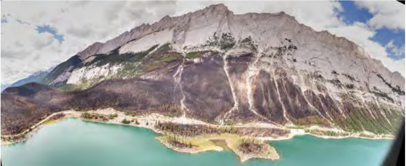
Le paysage du lac Medicine a radicalement changé à la suite de l'incendie du secteur Excelsior.