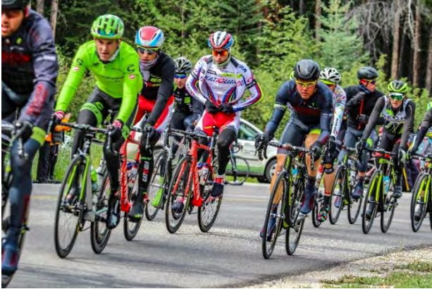
Tour de l'Alberta

La popularité croissante du cyclisme sur route a donné lieu à la création de nouveaux produits (p. ex. dépliant sur le cyclisme sur route) et de trois nouvelles activités.