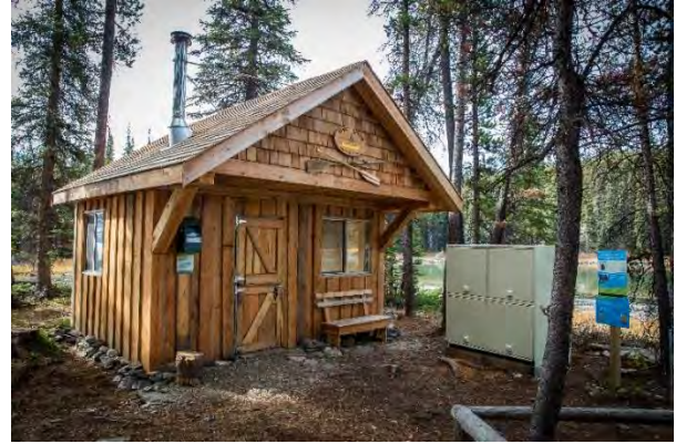
Le camping de l'Anse-Hidden a affiché complet tout au long de l'été.

Certains projets sont en cours, alors que d'autres seront entrepris dans les trois à cinq prochaines années. Pendant la mise en œuvre de ce programme, il faudra communiquer aux visiteurs et aux résidents des messages sur les ralentissements de la circulation et les changements apportés aux modes d'accès, réaliser des analyses d'impact environnemental, surveiller les projets, examiner des plans conceptuels et techniques et répondre à d'autres besoins liés aux projets (p. ex. dresser un plan à long terme d'extraction du gravier pour l'asphaltage et d'autres travaux d'entretien des routes).