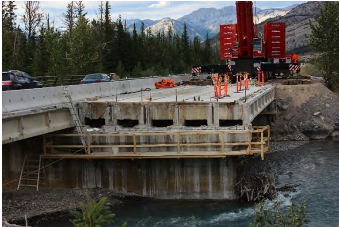
Les travaux réalisés sur les ponts de la rivière Rocky permettront aux automobilistes de circuler en douceur et en sécurité sur la route 16.

Le présent rapport annuel résume le travail que Parcs Canada a accompli dans le parc national Jasper d'octobre 2014 à septembre 2015. Il sert de complément à un forum public annuel qui offre à la population canadienne la possibilité de commenter les progrès réalisés dans la mise en œuvre du plan directeur du parc national Jasper. Les rapports annuels des années antérieures peuvent être consultés en ligne : http://www.pc.gc.ca/fra/pn-np/ab/jasper/plan.aspx .