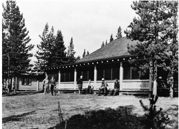
Les rondins écorcés et exposés du chalet du lac Maligne sont des éléments caractéristiques de l'architecture des premiers parcs nationaux.

En mars 2015, la Commission des lieux et monuments historiques du Canada a accordé au chalet et au petit hôtel du lac Maligne le statut de lieu historique national. Construits entre 1935 et 1942, ces deux bâtiments sont tout ce qu'il reste du camp du célèbre pourvoyeur et guide Fred Brewster sur la rive du lac Maligne. Ils illustrent l'important rôle joué par les pourvoyeurs, les guides et les chemins de fer dans le développement du tourisme dans les parcs nationaux des montagnes.