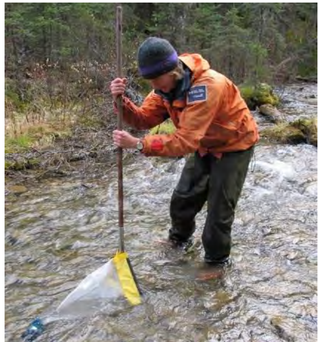
Le troubleau sert à remuer le fond rocheux du ruisseau, de manière à ce que les invertébrés aquatiques soient poussés vers l'aval dans un filet.

Nous rendons compte du résultat de nos activités de surveillance tous les 10 ans dans un rapport d'évaluation de l'état du parc, lequel oriente les travaux d'élaboration du plan directeur. La prochaine évaluation est prévue pour 2018.