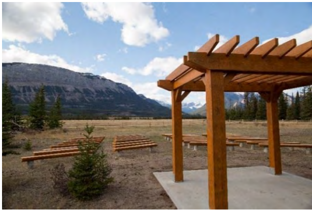
Les améliorations apportées aux aires de pique-nique et aux lieux de rassemblement de la plage Pyramid, de l'île Pyramid et de l'aire de fréquentation diurne Athabasca ont bien été accueillies.