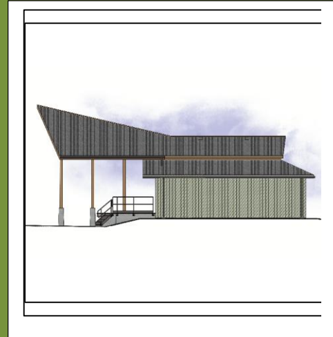
Vue latérale du nouvel amphithéâtre que construit Parcs Canada au camping Whistlers. Il sera prêt pour la saison de camping 2017.

À la fin d'août, Parcs Canada a entrepris la construction d'un nouvel amphithéâtre dans le camping Whistlers afin de remplacer l'installation originale, qui datait de 1969. L'équipe d'interprètes du parc national Jasper y présente des spectacles interactifs depuis des années. Bien que très apprécié et fréquemment utilisé, l'ancien amphithéâtre offrait peu d'espace pour le rangement et les activités intérieures, et il était parvenu à la fin de sa vie utile. À l'automne, Parcs Canada l'a enlevé en raison du piètre état des fondations, avant d'amorcer les travaux de construction de la nouvelle structure, qui fera près de deux fois la dimension de l'ancienne. Le nouvel amphithéâtre sera entièrement opérationnel dès la saison de camping 2017, à temps pour les célébrations du 150 e anniversaire du Canada.