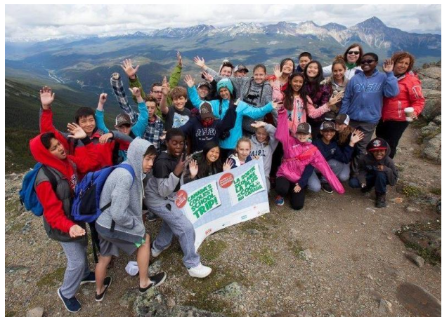
Les gagnants du concours La sortie scolaire la plus « cool » au Canada célèbrent au sommet des Rocheuses.

Nous avons réalisé de multiples activités de diffusion externe en milieu urbain à l'aide de la nouvelle exposition mobile « Quel est le lien? » pour sensibiliser les visiteurs du Telus World of Science de Vancouver et d'Edmonton et ceux du zoo de Calgary à l'importance du caribou, du pin à écorce blanche et de la gestion du feu.