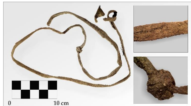
Une sangle en cuir vieille d'environ 270 ans a été découverte en 2015 lors de fouilles archéologiques dans des plaques de neige. Elle appartenait probablement à un chasseur de caribou.

Nos archéologues ont examiné des plaques de neige fréquentées par les caribous, à la recherche d'artefacts que des chasseurs auraient pu laisser tomber. Ces fouilles faisaient suite à des recherches menées à l'été 2015, lesquelles avaient mis au jour une sangle en cuir d'environ 270 ans. Quatre sites ont été examinés en 2016, mais rien n'y a été découvert.