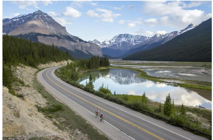
En voiture, à vélo ou à pied, le parc national Jasper offre des possibilités inoubliables d'exploration des Rocheuses.

Par souci de commodité, le rapport reprend les rubriques du plan directeur.