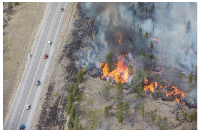
Le brûlage dirigé du 17 avril au complexe Jackladder, à 14 km au nord de Jasper, le long de la route 16.

Pour compléter le brûlage dirigé d'une parcelle de 111 ha dans le complexe Jackladder en 2015, Parcs Canada a procédé en avril à une seconde opération qui visait à brûler 102 ha, en vue de rétablir la prairie ouverte qui faisait autrefois partie du paysage de ce secteur.