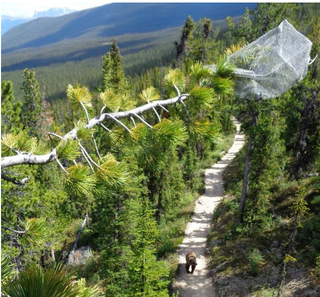
Un curieux inspecte une cage protégeant les cônes d'un pin à écorce blanche le long du sentier Astoria.

En 2016, Parcs Canada a continué d'agir pour rétablir le pin à écorce blanche, une espèce en voie de disparition, dans le parc national Jasper. En tout, 600 semis issus de graines de pin prélevées dans le parc ont fêté leur premier anniversaire en pépinière et seront prêts à être plantés à l'automne 2017. Parcs Canada a continué de mettre en cage les cônes de pins à écorce blanche qui semblent être résistants à la maladie de la rouille vésiculeuse. Ces cages protègent les graines contre la prédation, ce qui a permis de réunir une collection de plus de 40 000 graines cet