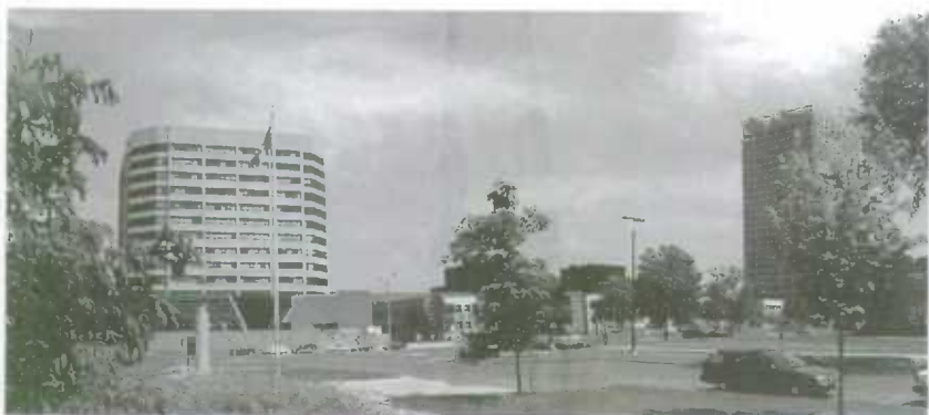
Statistique Canada, Parc Tunney, Ottawa. De gauche à droite: Immeuble Jean-Talon, Immeuble Principal, Immeuble R.H. Coats.

En tant qu'employé de Statistique Canada, vous travaillerez au Parc Tunney, un complexe d'immeubles gouvernementaux entourés de grands espaces verts, situé à environ 2 kilomètres à l'ouest du centre-ville, le long de la rivière des Outaouais. Le lieu est facile d'accès pour les usagers du transport en commun, et se trouve à proximité d'un grand secteur résidentiel ainsi que des boutiques, des restaurants et des parcs le long de la rivière des Outaouais. Tous ces attraits font de cet endroit un lieu de travail par excellence.