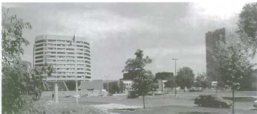
Statistics Canada, Tunney's Pasture, Ottawa From left to right: Jean Talon Building, Main Building, R.H. Coats Building

As an employee of Statistics Canada, you will be working at Tunney's Pasture, a campus of government offices surrounded by scenic green space about 2 kilometres west of downtown, along the Ottawa River. The campus borders a large residential area, with easy access by public transportation. There is also an abundance of nearby shops, restaurants, and riverside parks. All of these factors combine to make Tunney's Pasture an ideal work location.