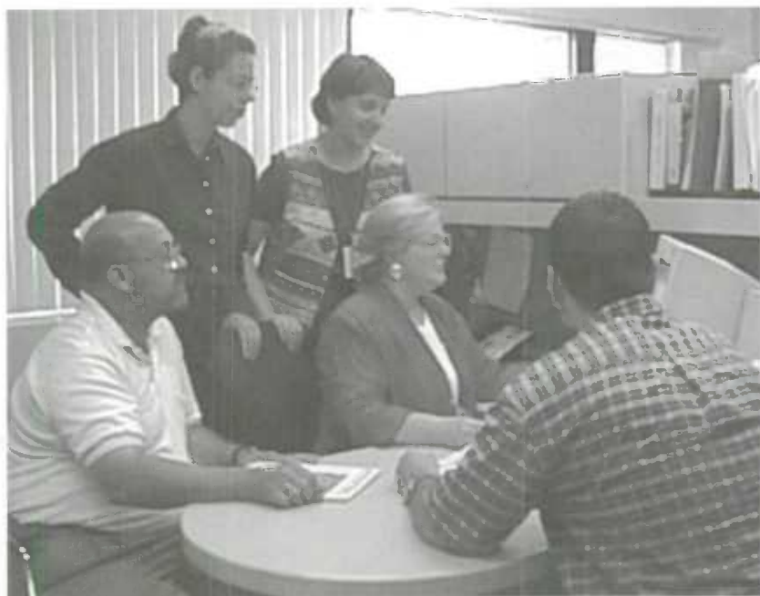
À Statistique Canada, la consultation et l'échange d'idées entre statisticiens constituent des sources privilégiées de formation et de perfectionnement.

Selon le statisticien en chef, "L'équité en matière d'emploi est un objectif fondamental en vertu duquel nous cherchons à constituer le plus vaste bassin possible d'employés et de chefs de file". Le Programme de l'équité en matière d'emploi permet aux personnes ayant une incapacité, aux Autochtones, aux femmes et aux membres des minorités visibles de surmonter les obstacles d'ordre matériel, comportemental ou systématique en milieu de travail.