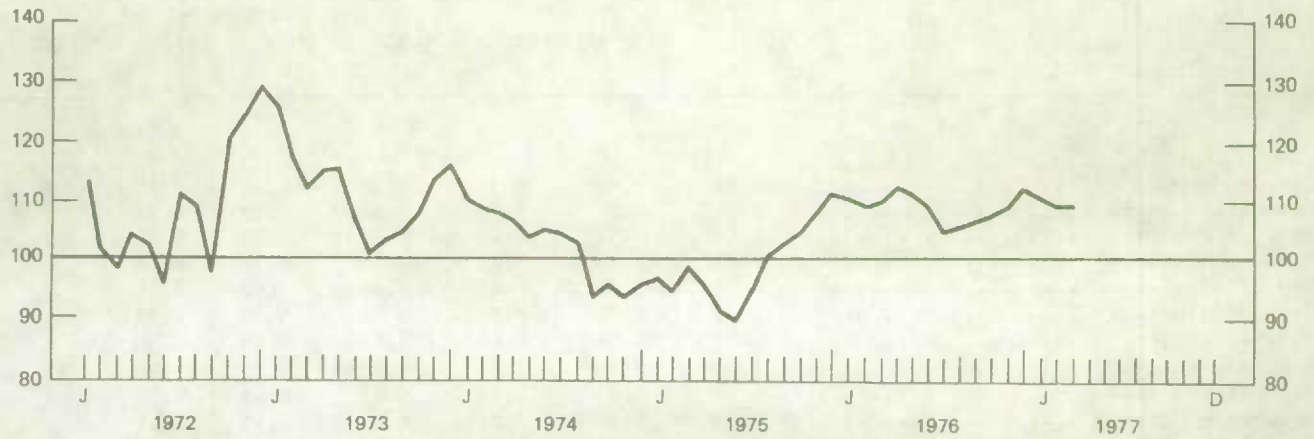
Chart - 2