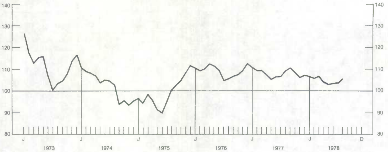
Chart — 2