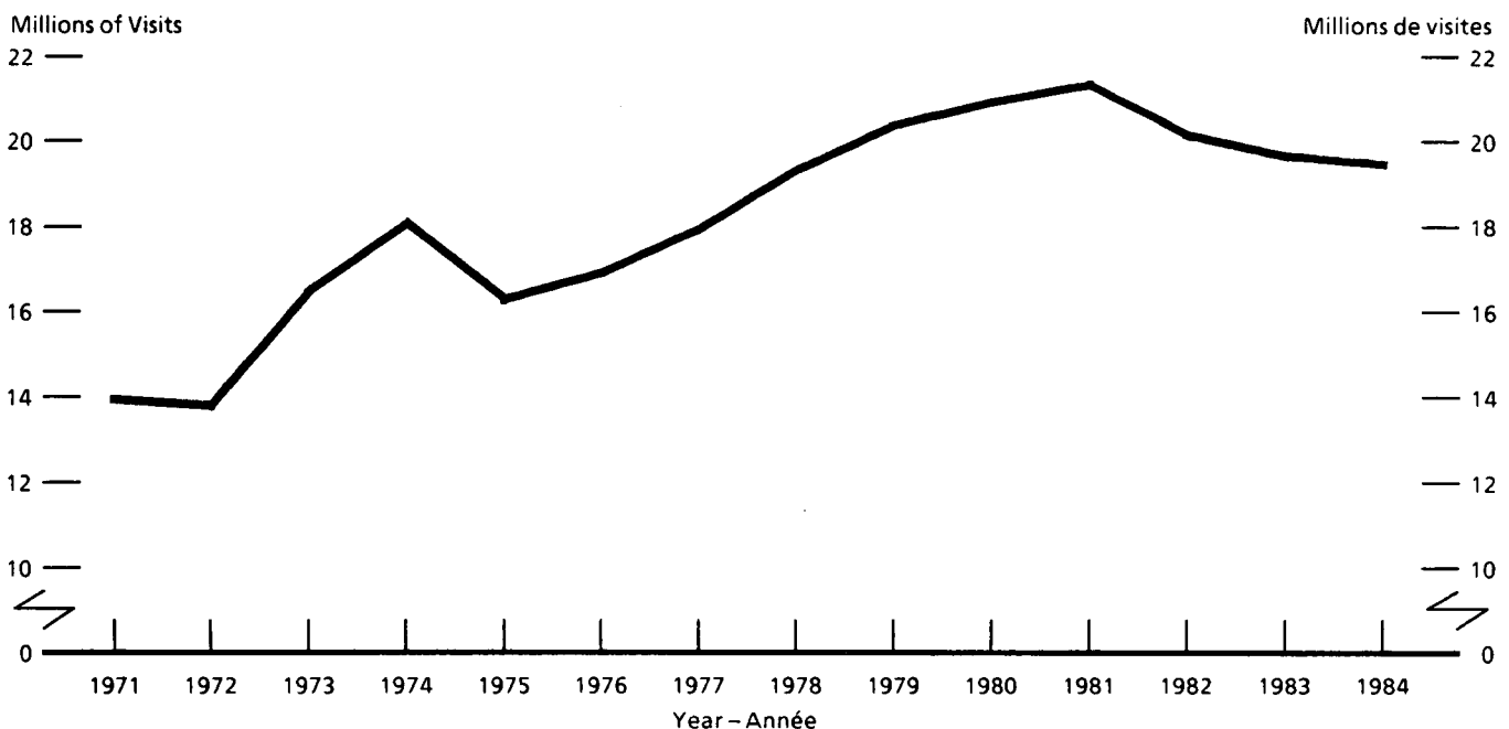
Graphique - 1