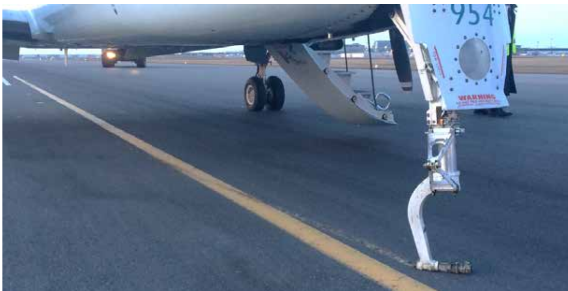
Figure 2. L'aéronef en cause dans l'événement à l'étude sur la piste 17R