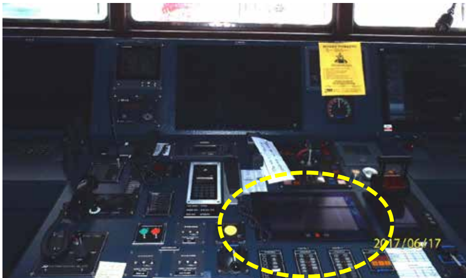
Figure 2. La console centrale de la passerelle du Damia Desgagnés , où est installé sur un plan horizontal l'écran tactile du système de navigation intégré qui a été activé et a causé l'arrêt accidentel de la machine principale

Lorsque le bouton d'arrêt de la machine principale a été activé sur l'écran tactile, un message d'état du système est apparu, indiquant : « SLOWDOWN alarm. CANCELLABLE UNIC SLOWDOWN REQUEST[.] Engine will be reduced in 60 sec » [Alarme de RALENTISSEMENT. DEMANDE DE RALENTISSEMENT UNIC 2 ANNULABLE. La machine ralentira dans 60 sec.] (figure 3). Le message ne précisait pas que la machine était sur le point de s'arrêter, ni de quelle manière ou de quel endroit l'arrêt avait été déclenché (de la passerelle, de la salle des machines, arrêt d'urgence, etc.) 3 .