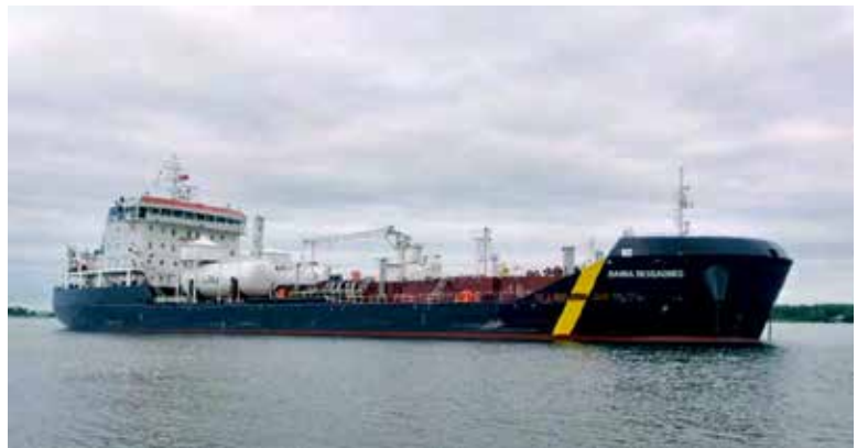
Figure 1. Damia Desgagnés

Le Damia Desgagnés a fait route à vitesse réduite en direction de l'écluse. De 19 h 50 à 22 h 50, l'équipage a reçu des mises à jour régulières du centre de contrôle de circulation à Iroquois, indiquant qu'il y aurait des retards supplémentaires et que le mur d'approche était occupé par un autre navire montant. Le capitaine a