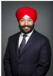
L'honorable Navdeep Bains Ministre de l'Innovation, des Sciences et du Développement économique

J'ai le plaisir de vous présenter le Plan ministériel du CanNor pour 2018-2019.