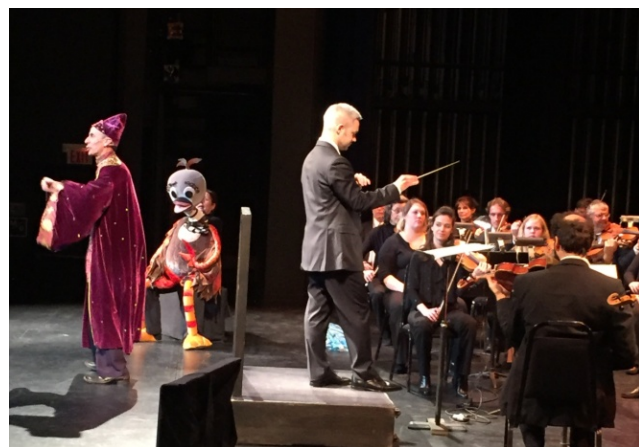
Photos : Matinée scolaire À la recherche du chant perdu .