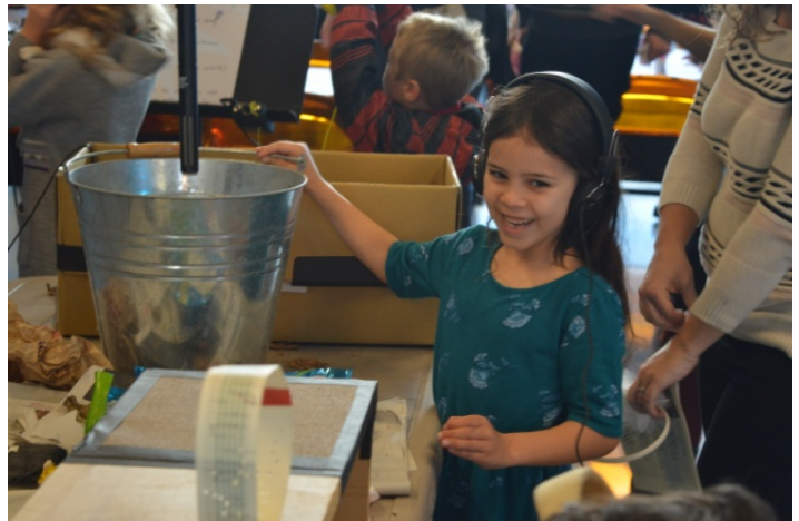
Photos (D-G) : Un enfant de 3 e année de l'École Francojeunesse (photo fournie); des enfants prennent part à une activité d'avant-spectacle avec leurs parents.