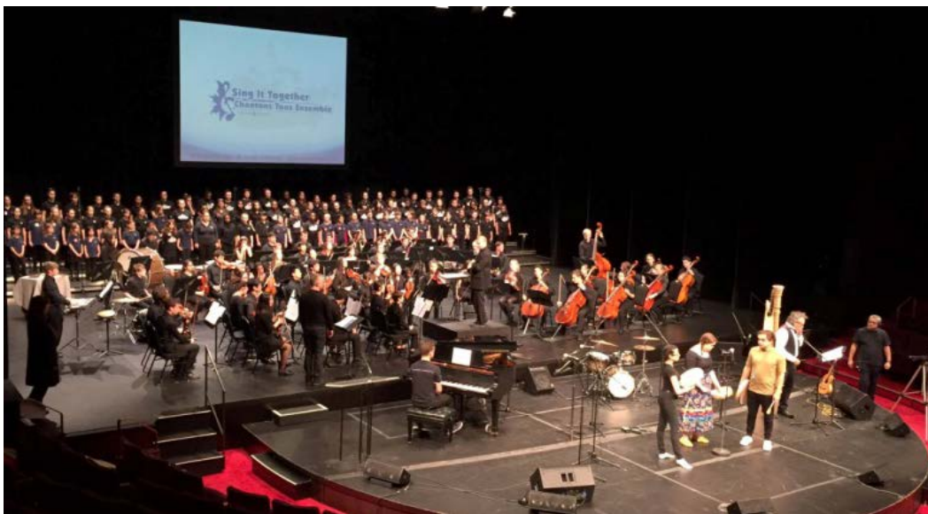
Photo : Le concert national 2017 Lundi en musique à la Salle Southam.