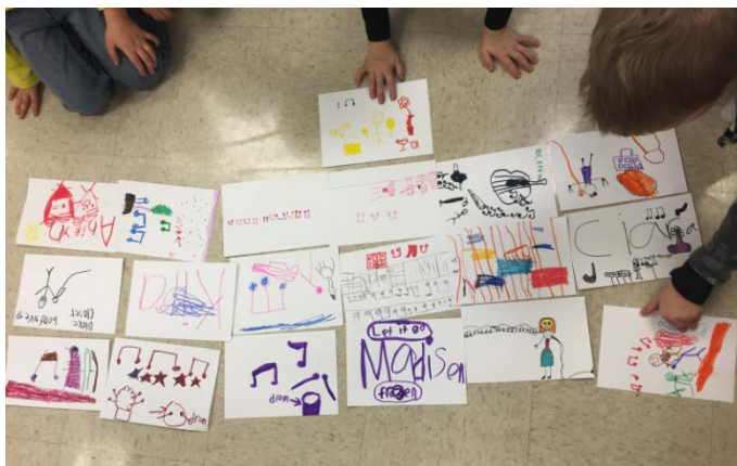
Photo : Des dessins d'enfants de l'École Greely Road à Fort McMurray.