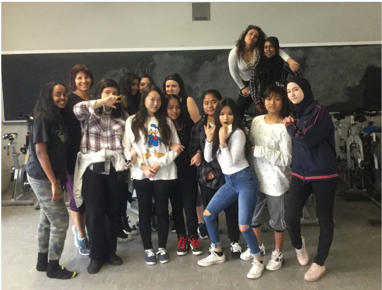
Photo : Un groupe de l'École Ridgemont assiste à l'atelier d'introduction à la danse contemporaine de deux heures.

Le 7 avril, plus de 100 jeunes et 3 enseignants ont assisté à une prestation de la Compagnie Virginie Brunelle au CNA. Les élèves étaient ensuite conviés au Studio pour une discussion sur le spectacle, animée par Erika Mills, directrice du Département de danse à l'École secondaire publique De La Salle.