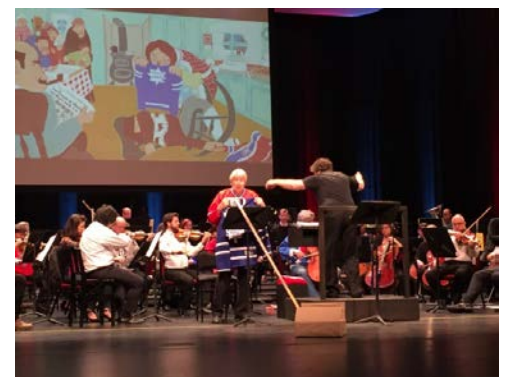
Photos (G-D) : Activités DORÉMIVILLE avant Pierre et le loup ; les 7 doigts de la main dans Pierre et le loup ; Rick Mercer dans Pierre et le loup ; Roch Carrier et l'Orchestre du CNA dans Le Chandail de hockey .