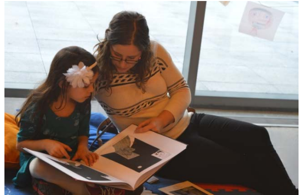
Photo : Les enfants avaient accès à un coin-lecture, créé en collaboration avec la Bibliothèque publique d'Ottawa, pour lire ou prendre des photos.

Les familles étaient attendues 45 minutes avant chaque représentation familiale du Théâtre français pour participer à des activités de bricolage reliées au spectacle en cours. En plus des différentes activités d'avant-spectacle, le collectif L'eau du bain a proposé une installation sonore interactive. Avant le spectacle, les enfants ont pu raconter leurs visions nocturnes, plongé leurs mains dans des feuilles mortes ou tapoté un seau en acier. L'artiste Thomas Sinou a ensuite réalisé un montage de ce « rêve collectif infini » qui a été diffusé en ligne.