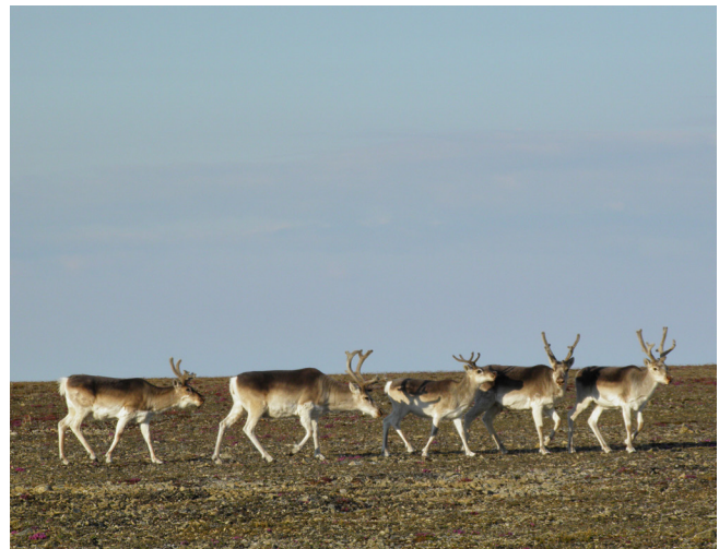
Le caribou de Peary dans son habitat typique de l'Arctique

répartition peut être caractérisée comme un désert polaire marqué d'étés courts et frais et d'hivers longs et froids. La saison de croissance est brève (de 50 à 60 jours) et variable. En général, la couverture de neige est présente de septembre à mai (île Banks) ou jusqu'aux dernières semaines de juin (île Melville). La couverture terrestre dominée par une végétation sèche représente environ 36 % de la zone dépourvue de glace de l'aire de répartition du caribou de Peary, tandis que le terrain va d'étendues relativement plates (sud et ouest) à montagneuses (nord et est). Le climat présente une forte variation régionale, avec des gradients est-ouest et nord-sud des précipitations et des températures, qui influe sur la productivité primaire et la disponibilité de nourriture. La biomasse végétale aérienne varie de moins de 100 g/m 2 (îles Reine Élisabeth et parties du groupement des îles Prince of Wales et Somerset) jusqu'à une quantité de 500 à 2 000 g/m 2 dans certaines régions (île Banks et île Prince of Wales). Le caribou de Peary a un régime alimentaire diversifié et polyvalent, son alimentation variant selon les saisons, en fonction de la nourriture disponible et de la valeur nutritive connexe. Essentiellement, tout l'habitat historique du caribou de Peary est disponible et n'a pas été perdu ou fragmenté par des développements industriels ou autres développements anthropiques.