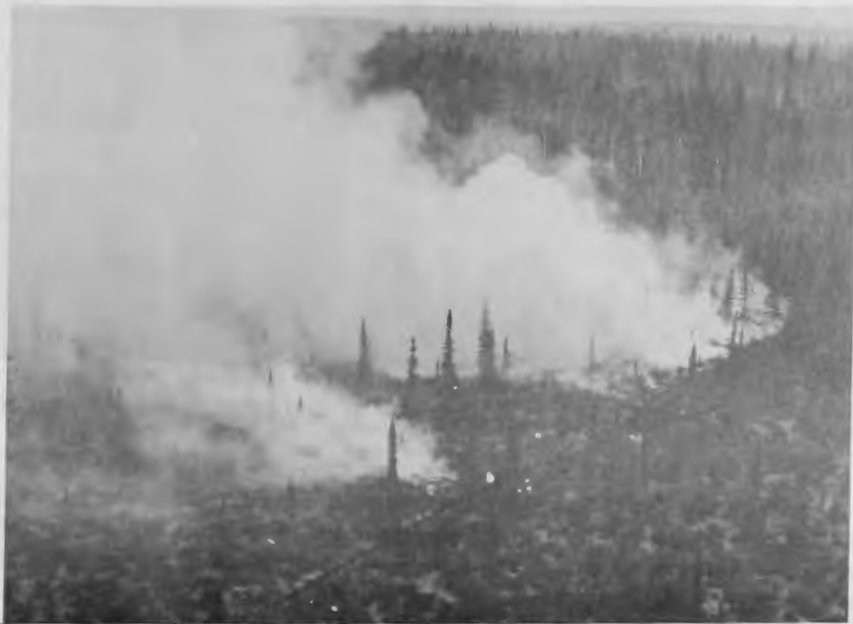
The Fire Line.