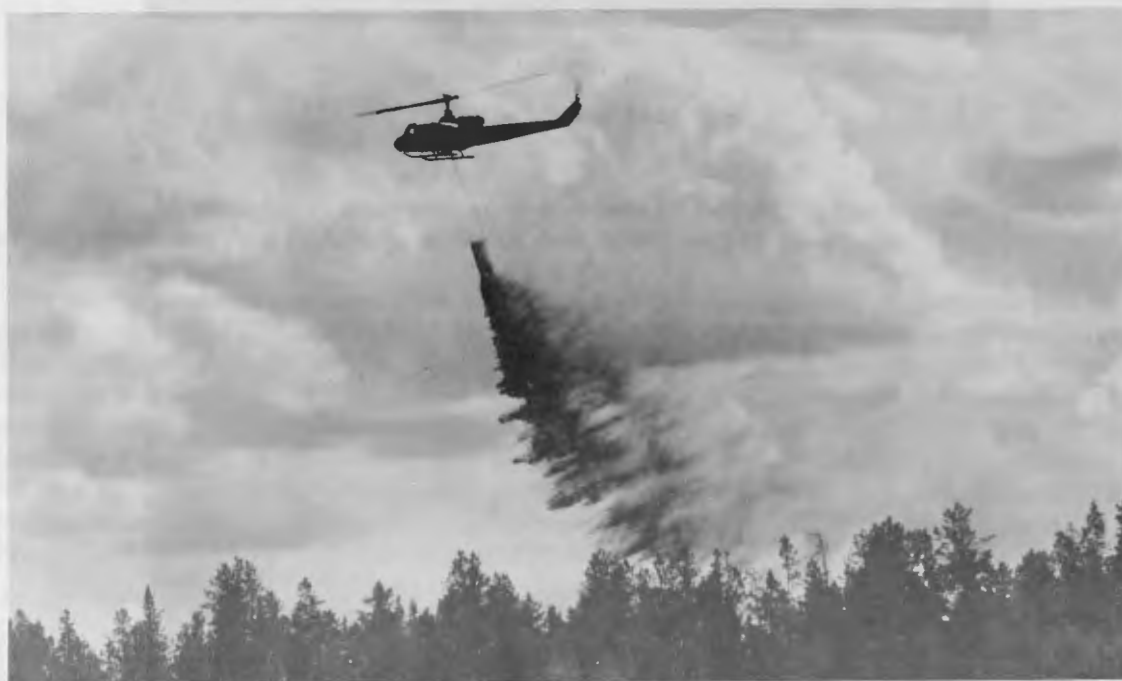
Dropping Retardant from Monsoon Bucket.