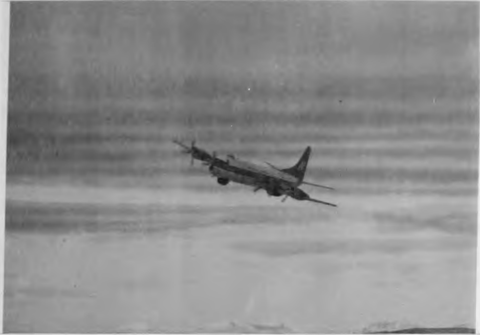
Ice Recco Aircraft CF NAZ to the rescue Norwegian Bay Sept. 1974.