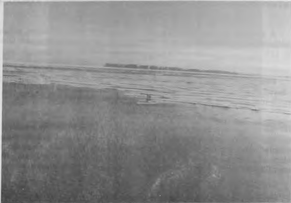
Resolute Bay, August 1974.