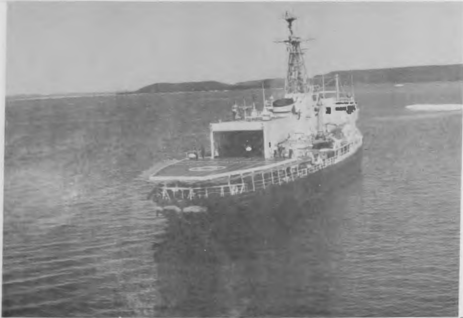
Botwood Harbour July 10 (Arctic Ice Floes in Background).