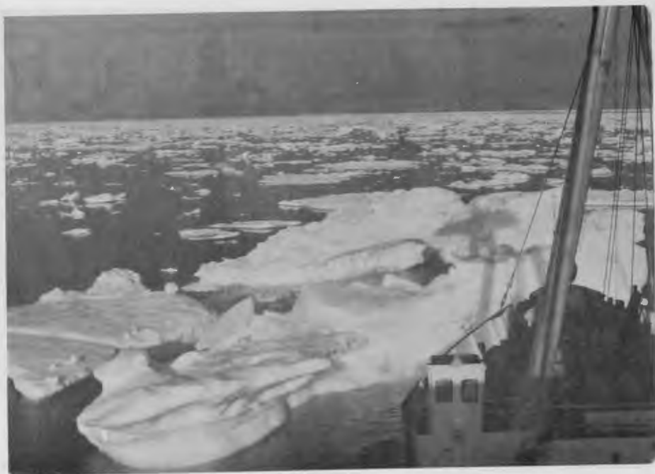
Approaches To Strait of Belle Isle July 1974.