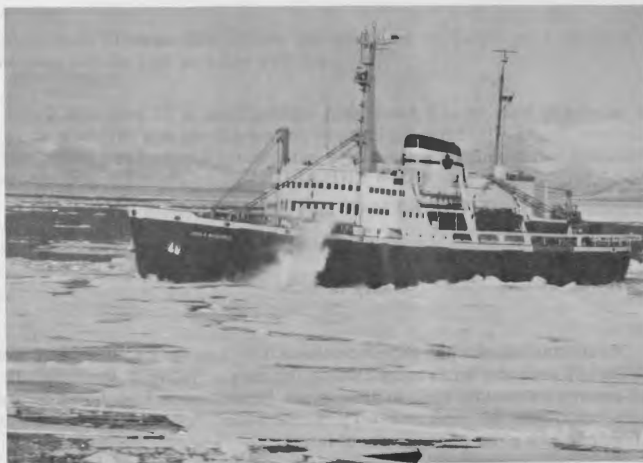
CCGS John A. MacDonal Norwegian Bay Sept. 1974 Eureka Convoy Escort.

In contrast to Newfoundland and the western Arctic, ice conditions in the eastern Arctic this past summer were near perfect, shipping into and out of Resolute Bay was uninterrupted throughout the entire resupply season.