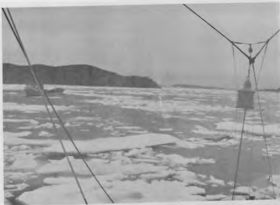
Approaches To Botwood Nfld. July 8, 1974.