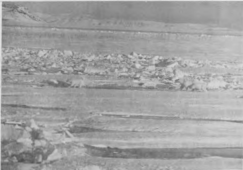
("Old Time") Ice Observers Eureka Sound Sept 1974.