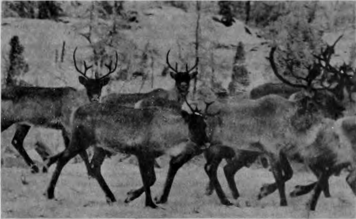
Rassemblement des Caribous avant de traverser la rivière.