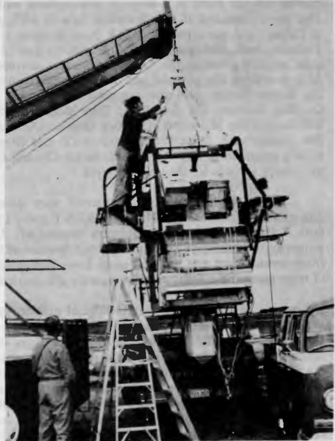
Stratoprobe III Payload, fourteen instrument systems plus two on-board cameras.

Poids utile pour stratoprobe III quatorze systèmes d'instruments et deux systèmes photographiques de bord.