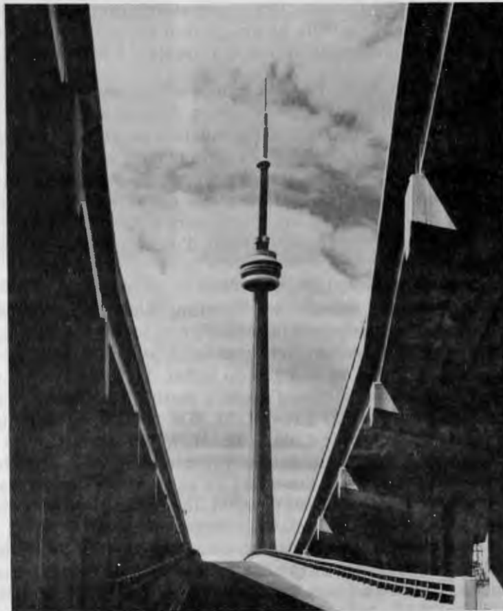
The CN Tower - Toronto, Ontario.

The levels to be instrumented are 510', 910', 1180', and 1815'. Wind speed, wind direction and temperature will be measured at all four levels, while only the lower three will measure the gaseous parameters: ozone ( O_3 ), sulphur dioxide ( SO_2 ), nitric oxide (NO), nitrogen dioxide ( NO_2 ), and aerosols (visibility, nitrate and sulfate content). Possible additions to gaseous measurements later may be carbon monoxide (CO), methane and non-methane hydrocarbons.