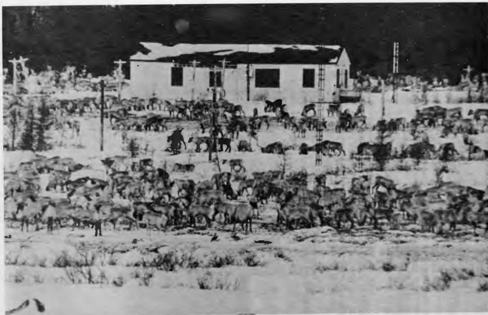
Caribous autour du site du transmetteur.