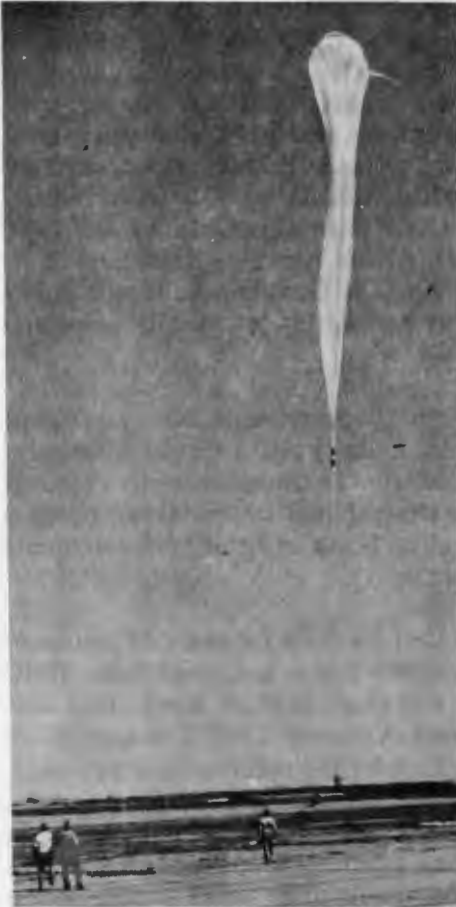
Stratospheric Balloon Launch. Lâcher de ballon stratosphérique.

As a result of recommendations arising out of the stratospheric research program at AES, a voluntary phase out of chlorofluoromethanes (freons) as a propellant in aerosol cans is underway. Dr. B.W. Boville, ARPD, represented AES during the scientific presentations made to Cabinet in Ottawa. The program of stratospheric research within AES will be continuing into the future to further narrow the uncertainty range in predictions of ozone layer depletions.