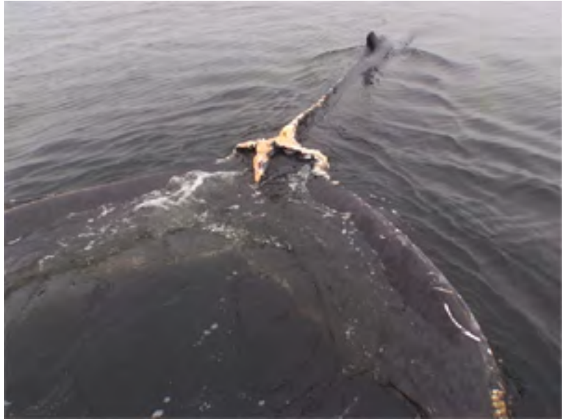
Figure 1 : Une fois la baleine libérée de l'engin de pêche, on la voit s'éloigner avec une blessure au pédoncule.

Dans cette région, le Programme d'intervention auprès des mammifères marins a recours aux services d'une organisation externe, le groupe Whale Release and Stranding. La Région de T.-N.-L. accueille la population de rorquals à bosse en quête de nourriture la plus importante de l'Atlantique Nord-Ouest : environ 5 000 rorquals fréquentent les eaux de T.-N.-L. au cours du printemps, de l'été et de l'automne. Ces rorquals ont donné naissance à une importante industrie du tourisme dans la Région de T.-N.-L.. L'industrie de la pêche est également importante dans cette région.