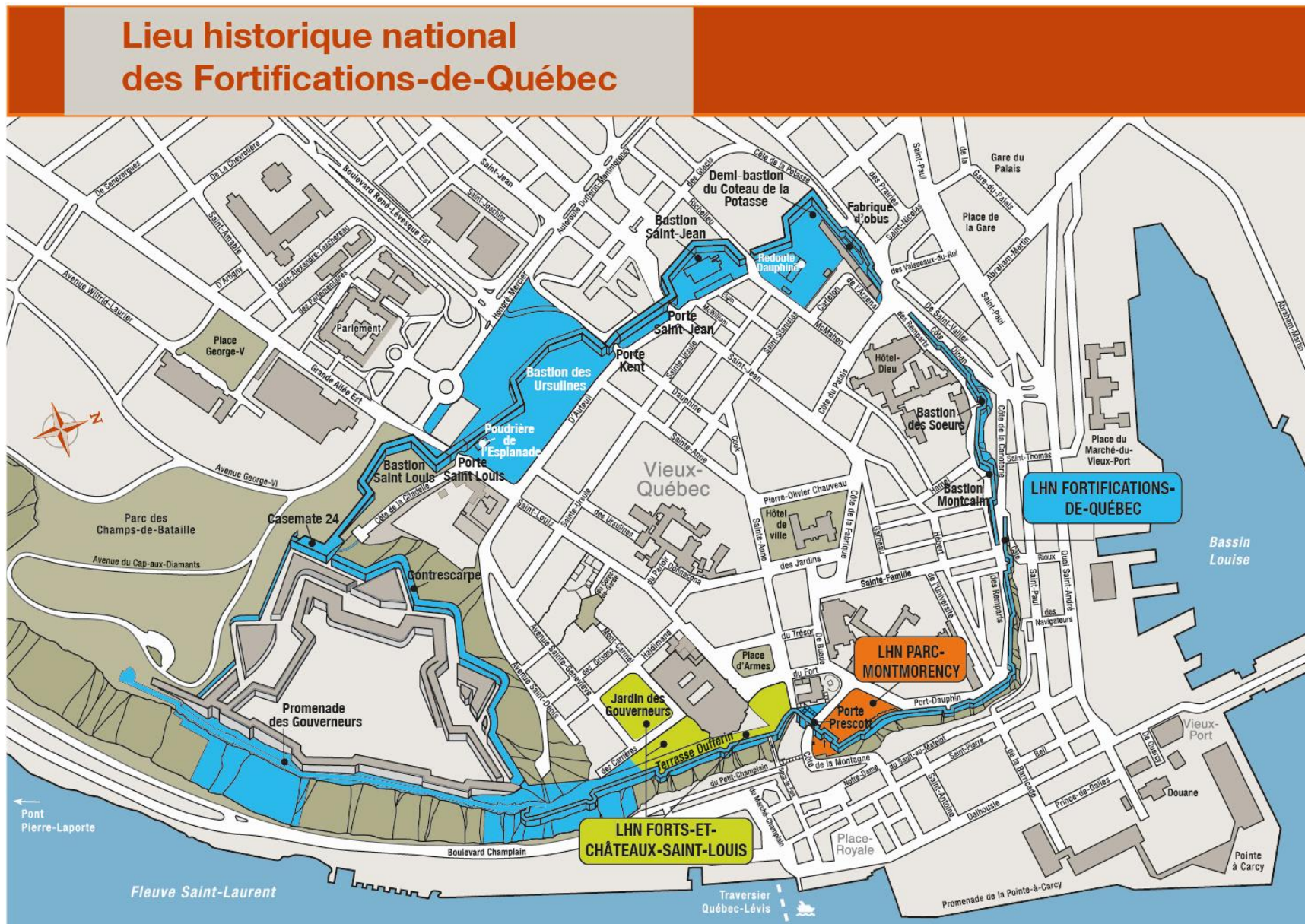
Carte 2 : Lieu historique national des Fortifications-de-Québec – Lieu administré