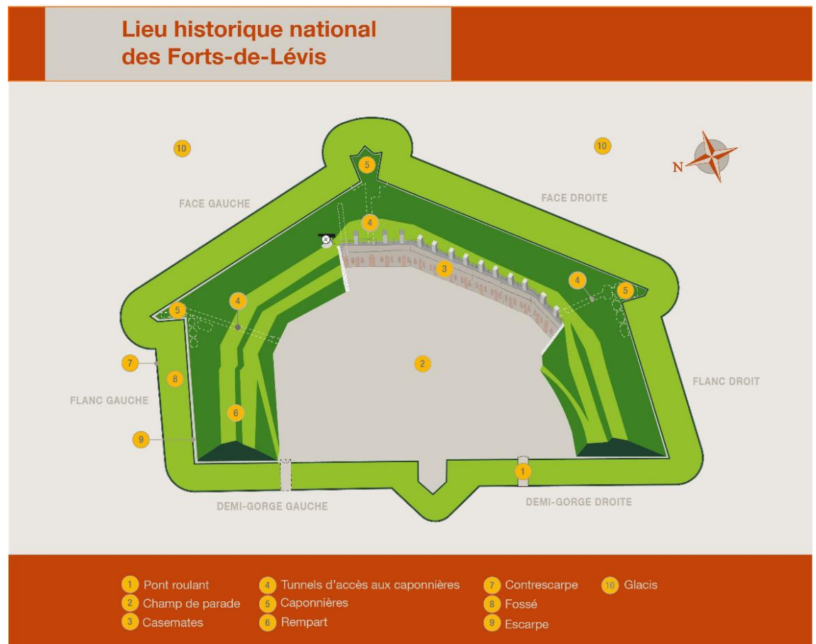
Carte 3 : Lieu historique national des Forts-de-Lévis – Fort Numéro-Un

Le lieu historique national des Forts-de-Lévis est situé à Lévis, sur la rive sud du fleuve Saint-Laurent. Il a été désigné en raison de son importance stratégique dans la défense de Québec. Il est constitué de plusieurs composantes dont les principales sont trois forts : les forts Numéro-Un, Numéro-Deux et Numéro-Trois. Ils forment une chaîne d'ouvrages militaires qui a été érigée entre 1865 et 1872 afin de protéger les abords de Québec et son port d'une attaque éventuelle venant des États-Unis. Cet ensemble constitue le seul exemple au Canada du système des forts détachés mis en place pour la défense des grandes villes britanniques dans la deuxième moitié du 19 e siècle. Parcs Canada est propriétaire du fort Numéro-Un, seul fort qui subsiste encore aujourd'hui. Les autres éléments constituant ce lieu historique appartiennent à des tiers.