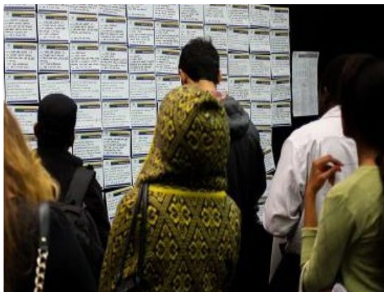
Source : Étude : Les travailleurs à la recherche d'un nouvel emploi, 2014

Au Canada, 12 % des travailleurs rémunérés ont déclaré avoir entrepris des démarches pour trouver un nouvel emploi au cours du mois précédent. Cette proportion est à la hausse depuis le milieu des années 1990, où elle s'élevait à environ 5 %. Ces résultats proviennent d'une nouvelle étude intitulée « Les travailleurs à la recherche d'un nouvel emploi ». L'étude examine les raisons qui poussent ces travailleurs à vouloir quitter leur emploi.