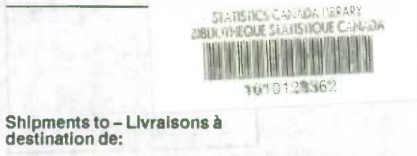
TABLE 1. Shipments of Corrugated Boxes and Wrappers, by Province of Destination 1 - Concluded