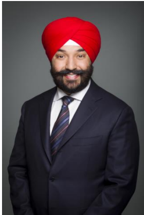
L'honorable Navdeep Bains Ministre de l'Innovation, des Sciences et du Développement économique

J'ai le plaisir de vous présenter le Plan ministériel de Statistique Canada pour 2018-2019.