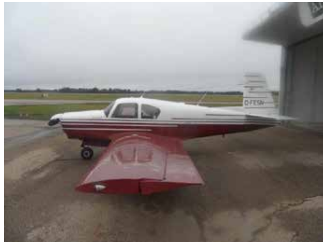
Figure 1. L'aéronef à l'étude

À 14 h 22 2 , le 25 novembre 2017, l'aéronef Mooney M20D privé (immatriculation C-FESN, numéro de série 192) (figure 1) a quitté l'aéroport de Penticton (CYYF) (Colombie-Britannique) avec 2 personnes à bord, pour effectuer un vol selon les règles de vol à vue (VFR) à destination de l'aéroport d'Edmonton/Villeneuve (CZVL) (Alberta). Après son départ de CYYF, alors qu'il se dirigeait tout droit vers l'aéroport de Revelstoke (CYRV) (Colombie-Britannique), l'aéronef a monté à une altitude 3 d'environ 9800 pieds au-dessus du niveau de la mer (ASL) pour survoler la chaîne de