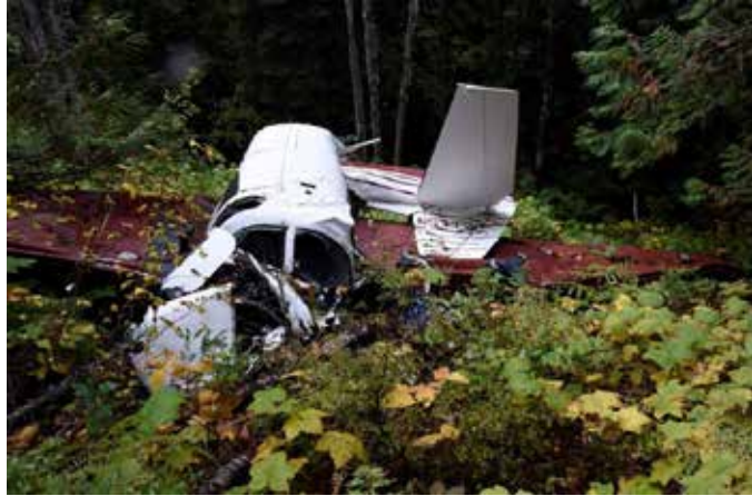
Figure 6. Lieu de l'accident, vu vers le bas de la pente

On a retiré le moteur de l'aéronef (Avco Lycoming O-360-A1D) pour l'examiner de plus près. On a déterminé que le moteur était capable de produire de la puissance au moment de l'impact. On a déterminé que le magnéto 8 de gauche était hors service et qu'il l'était depuis très longtemps avant l'événement. Cet état aurait entraîné une faible réduction de la performance du moteur.