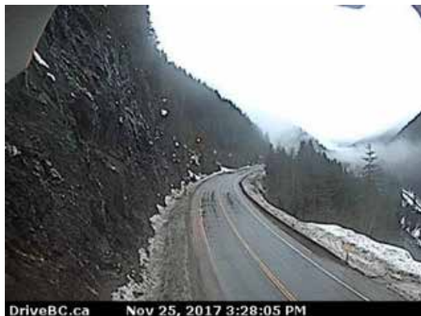
Figure 4. Vue vers le nord-est saisie à 15 h 28 à la galerie paravalanche Jack McDonald (3050 pieds ASL), à 22 nm au nord-est de CYRV, le jour de l'événement