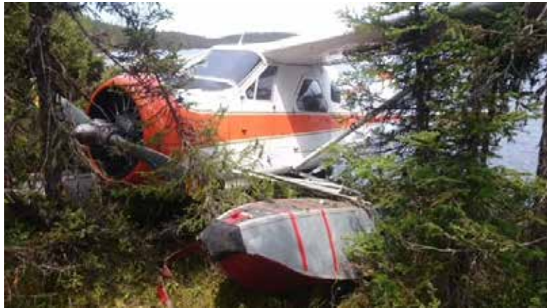
Figure 1. L'aéronef après la collision avec les arbres

immobilisé à temps pour éviter une collision avec les arbres (figure 1). Lors de l'impact, la radiobalise de repérage d'urgence (ELT) s'est déclenchée, et le premier signal a été reçu par le Centre conjoint de coordination des opérations de sauvetage (CCCOS) à Halifax (Nouvelle-Écosse) à 10 h 23.