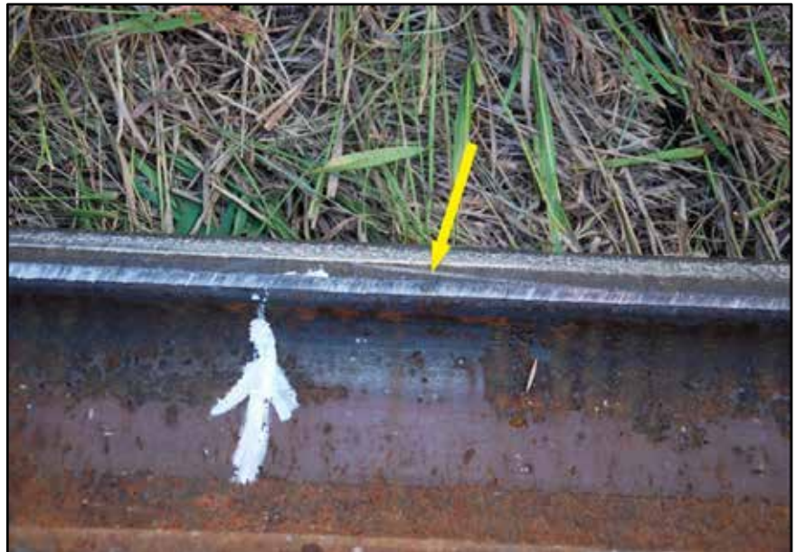
Figure 2. Marques de boudin de roue sur le champignon du rail au point de déraillement (indiquées par la flèche jaune)

Selon les marques de boudin de roue sur le champignon du rail (figure 2), le rail haut s'est probablement