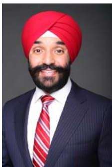
L'honorable Navdeep Bains Ministre de l'Innovation, des Sciences et du Développement économique

De concert avec les Canadiennes et les Canadiens de toutes origines, régions et générations, nous bâtissons une solide culture de l'innovation pour faire du Canada un chef de file de l'économie mondiale.