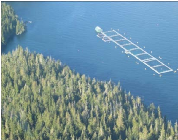
Parc en filet le long de la côte de la Colombie-Britannique (Photo : MPO).