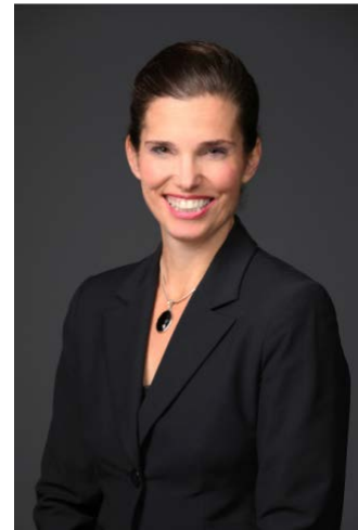
L'honorable Kirsty Duncan Ministre des Sciences et des Sports

De concert avec toutes les Canadiennes et tous les Canadiens de toutes origines, régions et générations, nous sommes fiers de bâtir une solide culture de la science, équitable, diverse et inclusive, qui fera du Canada un chef de file mondial de la recherche et de l'innovation en sciences naturelles et en génie.