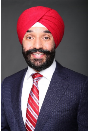
L'honorable Navdeep Bains Ministre de l'Innovation, des Sciences et du Développement économique

J'ai le plaisir de présenter le Plan ministériel 2019-2020 de Statistique Canada. Nous travaillons dans l'ensemble du Portefeuille d'Innovation, Sciences et Développement économique pour soutenir et développer l'écosystème de l'innovation, renforcer les sciences pour appuyer la prise de décisions fondées sur des données probantes, soutenir le secteur touristique et aider les petites entreprises à démarrer et à prendre de l'expansion.