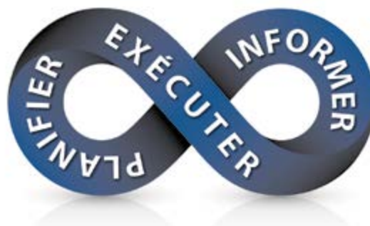
FIGURE 2 Cycle d'établissement du profil de pratiques commerciales