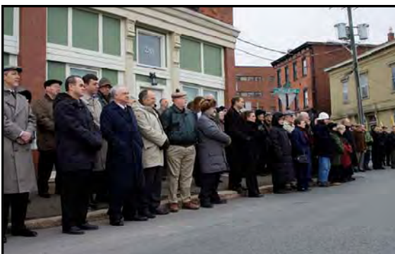
Service commémoratif, bateau-pilote No. 1 , 14 janvier 2007