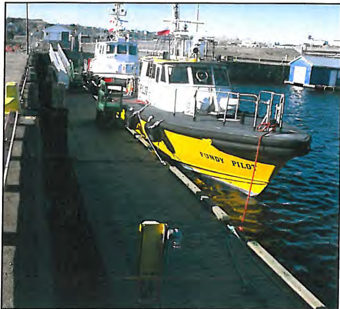
Le Fundy Pilot et le bateau-pilote n° 20 de l'APA à leur nouveau poste d'amarrage, dans le quartier West Side de Saint John.

Au milieu de 2009, l'APA a appris de l'Administration portuaire de Saint John (APSJ) que le quai dans le quartier West Side de Saint John, où l'APA avait l'habitude d'amarrer son bateau-pilote, n'était plus utilisable. Le quai a été enlevé et le Fundy Pilot sera amarré à son ancien emplacement à la base de la Garde côtière canadienne (GCC), près du terminal de paquebots de croisière Marco Polo, de l'autre côté du port.