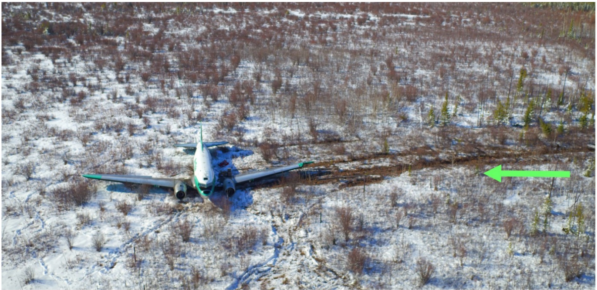
Figure 2. Photo aérienne du lieu de l'accident (vue vers le nord-ouest). La flèche verte indique la trajectoire de l'avion après son poser.

À 8 h 01, l'avion a atterri dans une fondrière sur les terres de la Première Nation K'at'l'Odeèche, à environ 3,5 milles marins au sud-est de CYHY. Une fois l'avion immobilisé, le PO a évacué l'avion par la fenêtre de droite du poste de pilotage, pendant que le commandant de bord est resté dans le poste de pilotage pour éteindre le moteur droit et les systèmes de bord avant d'évacuer l'avion par la porte avant. Le PO a joint le centre d'information de vol pour l'aviser de l'état de l'équipage de conduite et de l'emplacement de l'avion. La radiobalise de repérage d'urgence ne s'est pas déclenchée durant l'atterrissage forcé, donc le PO l'a activée manuellement pour aider les ressources de recherche et sauvetage (SAR) à repérer l'épave. L'équipage de conduite n'a pas subi de blessures. L'avion a été lourdement endommagé (figure 2). Il n'y a pas eu d'incendie après l'impact. Les premiers intervenants sont arrivés sur les lieux de l'accident à 11 h 14.