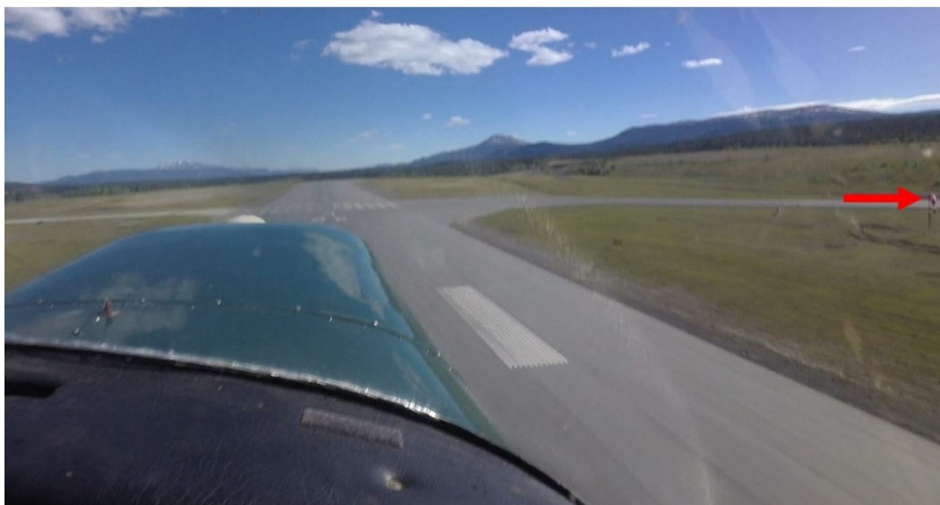
Figure 2. Image saisie au décollage (à 17 h 29 min 38 s). La flèche rouge montre la manche à air à l'extrémité éloignée de la piste 14R, indiquant des vents calmes.

À 900 pieds de l'extrémité de la piste, après être monté à quelque 50 pieds au-dessus de la surface de la piste, l'avion a amorcé une descente intempestive.